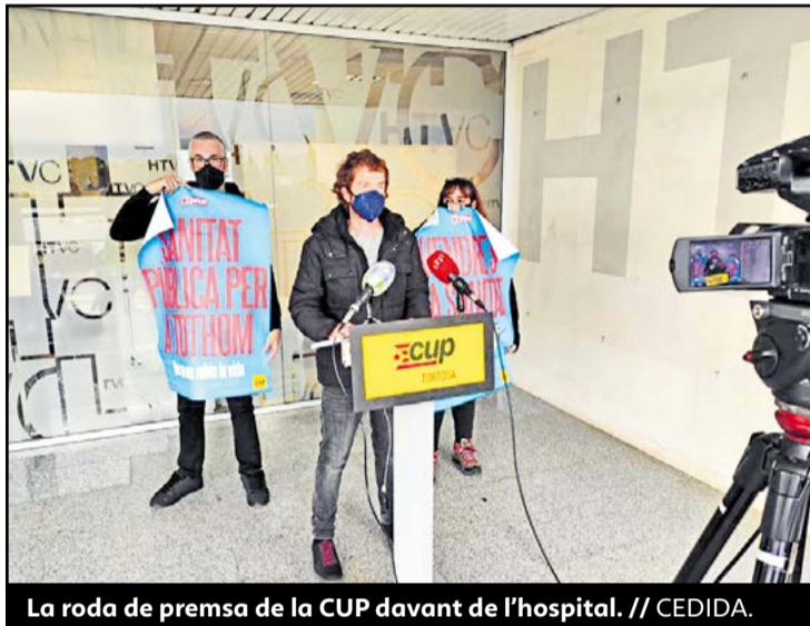
La roda de premsa de la CUP davant de l'hospital.

La CUP Tortosa va rebutjar el 6 de novembre la proposta del Departament de Salut d'ampliar l'Hospital de Tortosa Verge de la Cinta (HTVC) amb un nou edifici oncològic i un ambulatori, així com la construcció d'un aparcament soterrat de 300 places i la instal·lació de dos ascensors des de l'Eixample de Tortosa. "Considerem que aquest projecte no resoldrà les necessitats sanitàries ni d'accessibilitat a l'hospital de la gent de Tortosa ni de les Terres de l'Ebre", van afirmar des de la CUP, que proposa un front comú per aconseguir l'hospital que el territori es mereix. "No