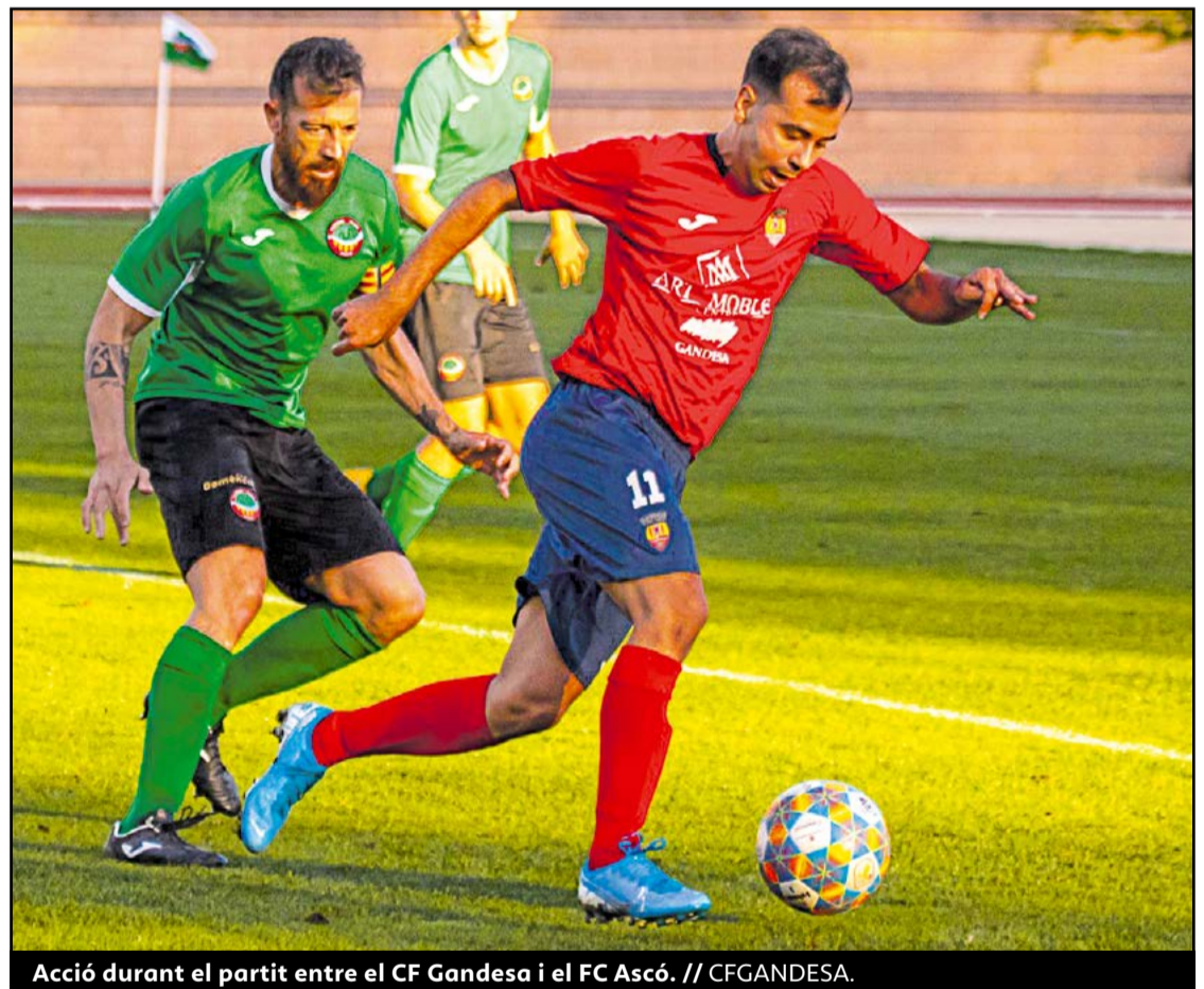
Acció durant el partit entre el CF Gandesa i el FC Ascó. // CFGANDESA.

Finalment, al quart tram, es mantindran les mateixes mesures, però es recuperaran les competicions esportives, que ja fa setmanes que estan parades. Algunes d'elles van començar amb la dispu-