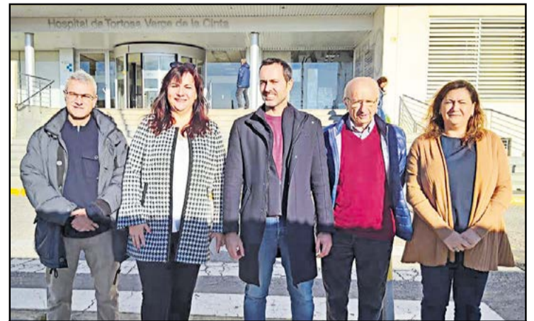
Al febrer, Movem ja va demanar un nou hospital.