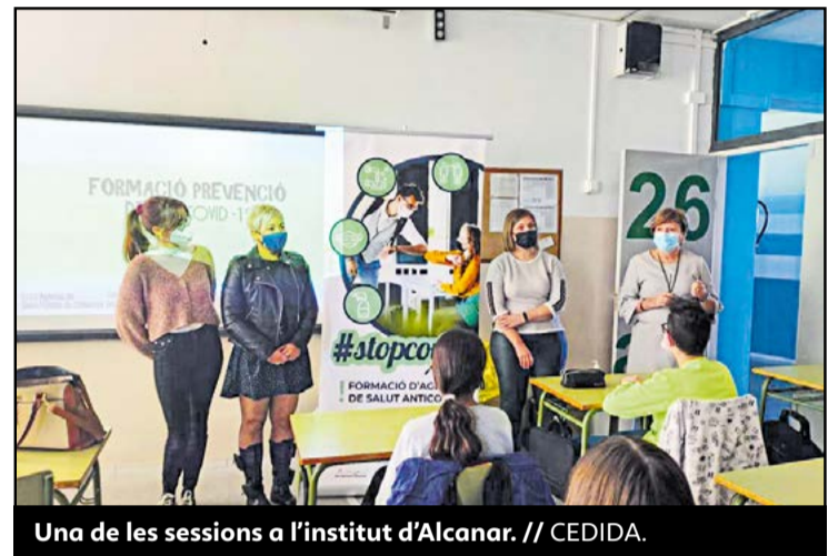
Una de les sessions a l'institut d'Alcanar.