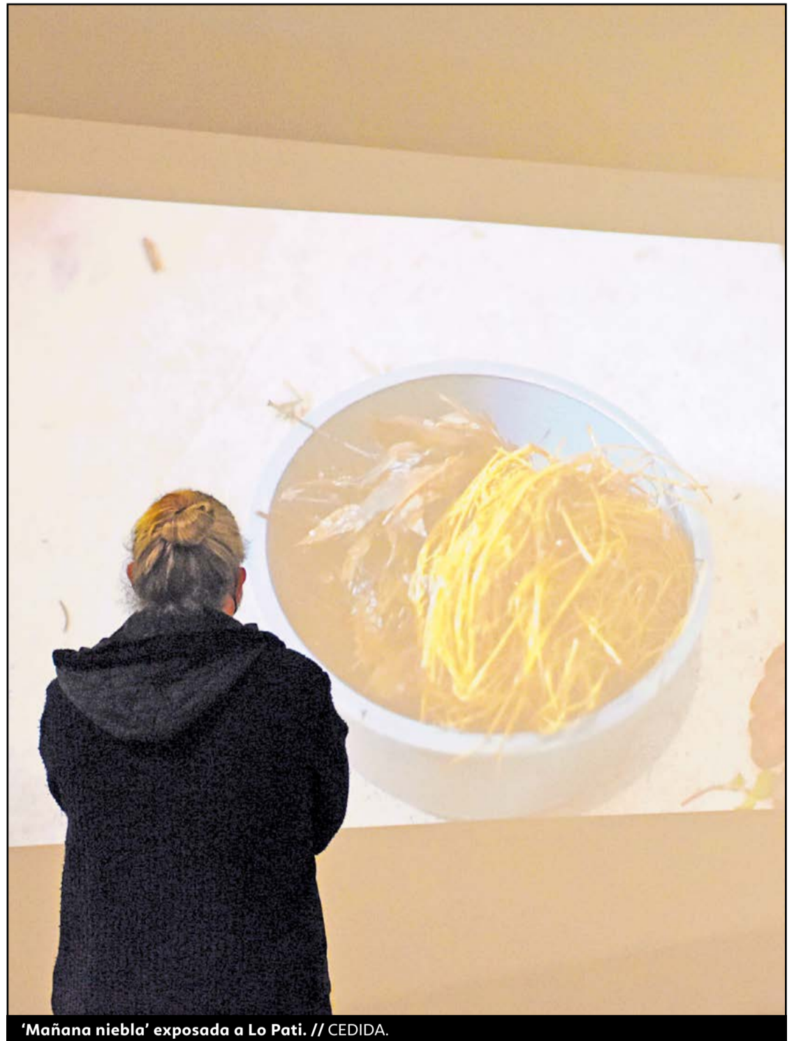
'Mañana niebla' exposada a Lo Pati.