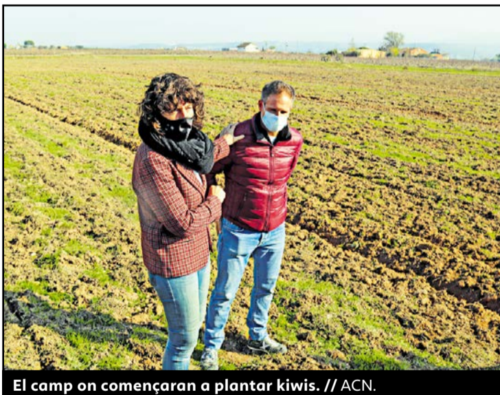
El camp on començaran a plantar kiwis. // ACN.