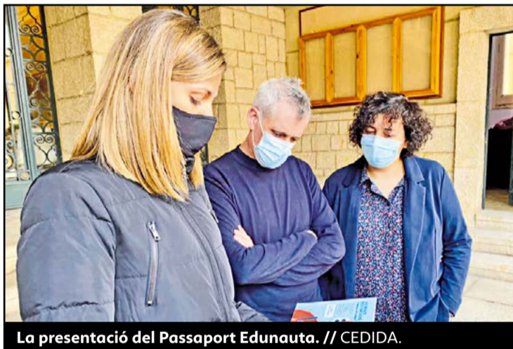
La presentació del Passaport Edunauta.