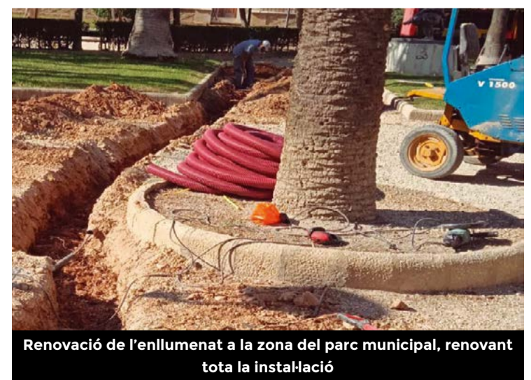
Renovació de l'enllumenat a la zona del parc municipal, renovant tota la instal·lació

El projecte de renovació de l'enllumenat públic d'Amposta compta amb una subvenció europea FEDER