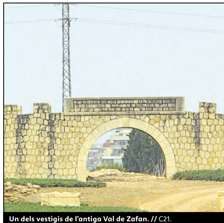
Un dels vestigis de l'antiga Val de Zafan. // C21.

CONSULTES EXTERNES • URGÈNCIES • SALA DE PARTS • HOSPITALITZACIÓ • QUIRÒFANS • PROVES DIAGNÒSTIQUES I TERAPÈUTIQUES