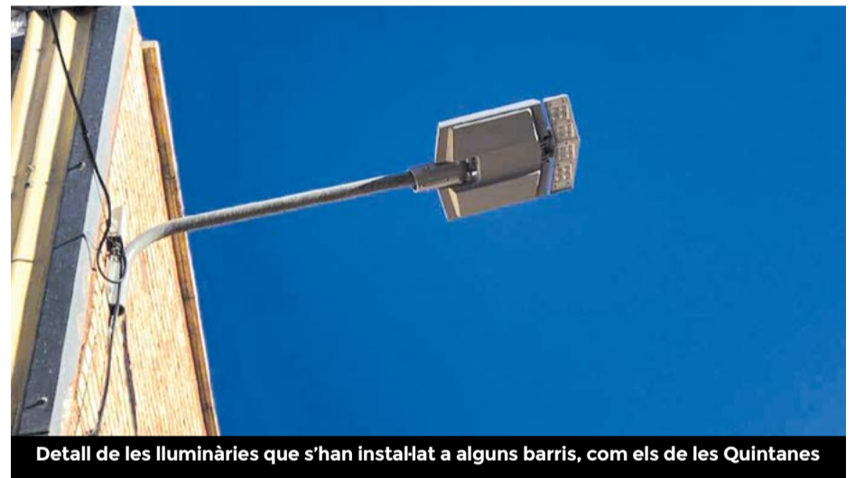
Detall de les lluminàries que s'han instal·lat a alguns barris, com els de les Quintanes