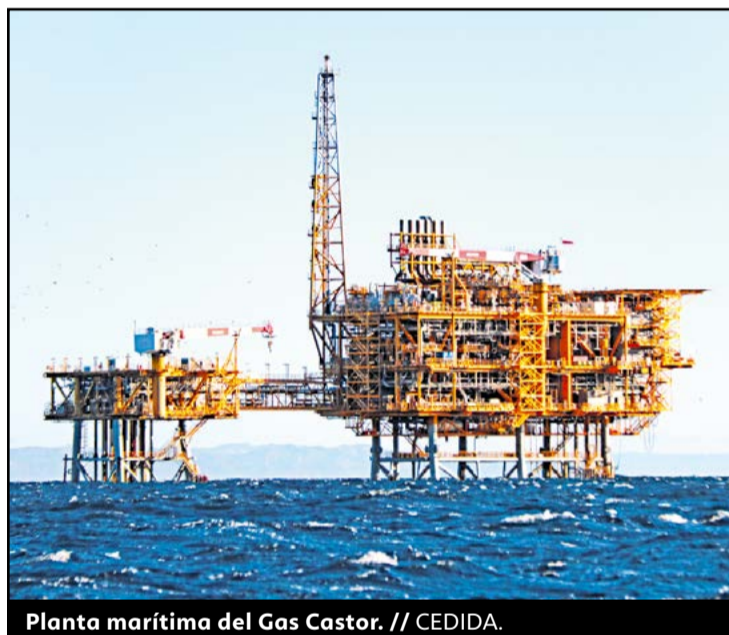
Planta marítima del Gas Castor.

Tot i que el cost pressupostat és, a priori de 69,65 milions d'euros en el cas que els treballs s'adaptin al programa previst de 201 dies, la possibilitat que es puguin observar "increments de pressió significatius" que requeririen treballs de reparació en la meitat dels pous, que elevarien el cost fins als 76,98 milions d'euros. Les tasques, segons detalla el projecte, començaran pels pous menys problemàtics –en els quals no hi ha instruments abandonats o restriccions de pas– i en alguns casos es requeriran operacions de punxat i injecció de ciment. Es comprovaran prèviament aquestes pressions als espais anulars que deixen els tubs telescòpics dels pous per si cal reparar-los addicionalment.