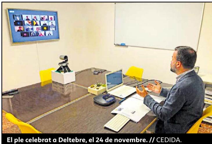
El ple celebrat a Deltebre, el 24 de novembre.

Els ajuntaments d'Amposta, Sant Carles de la Ràpita, Sant Jaume d'Enveja, Deltebre, Camarles, l'Aldea i l'Ampolla van aprovar el 24 de novembre una moció de la Taula de Consens rebutjant frontalment l'Estratègia Delta del govern espanyol, el pla d'actuacions amb el qual vol actuar per preservar este espai natural. Els consistoris van convocar, de forma extraordinària i sincronitzada, els respectius plens a les vuit de la tarda per discutir i aprovar la moció. Els set ajuntaments del Delta recorden que els plantejaments avançats pel Ministeri per a la Transició Ecològica