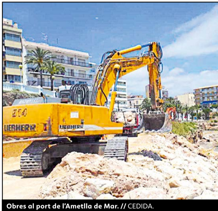
Obres al port de l'Ametlla de Mar. // CEDIDA.

De fet, el 60% de les noves inversions es concentraran als ports de la mar de l'Ebre. Joan Pere Gómez també ha detallat les obres que s'han fet al port de l'Ampolla, un dels més afectats pel Glòria de tot el litoral català. Amb un cost de 3,7 milions d'euros, a més de la pedra d'escullera per protegir el moll, també han po-