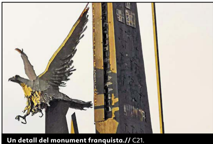
Un detall del monument franquista. // C21.