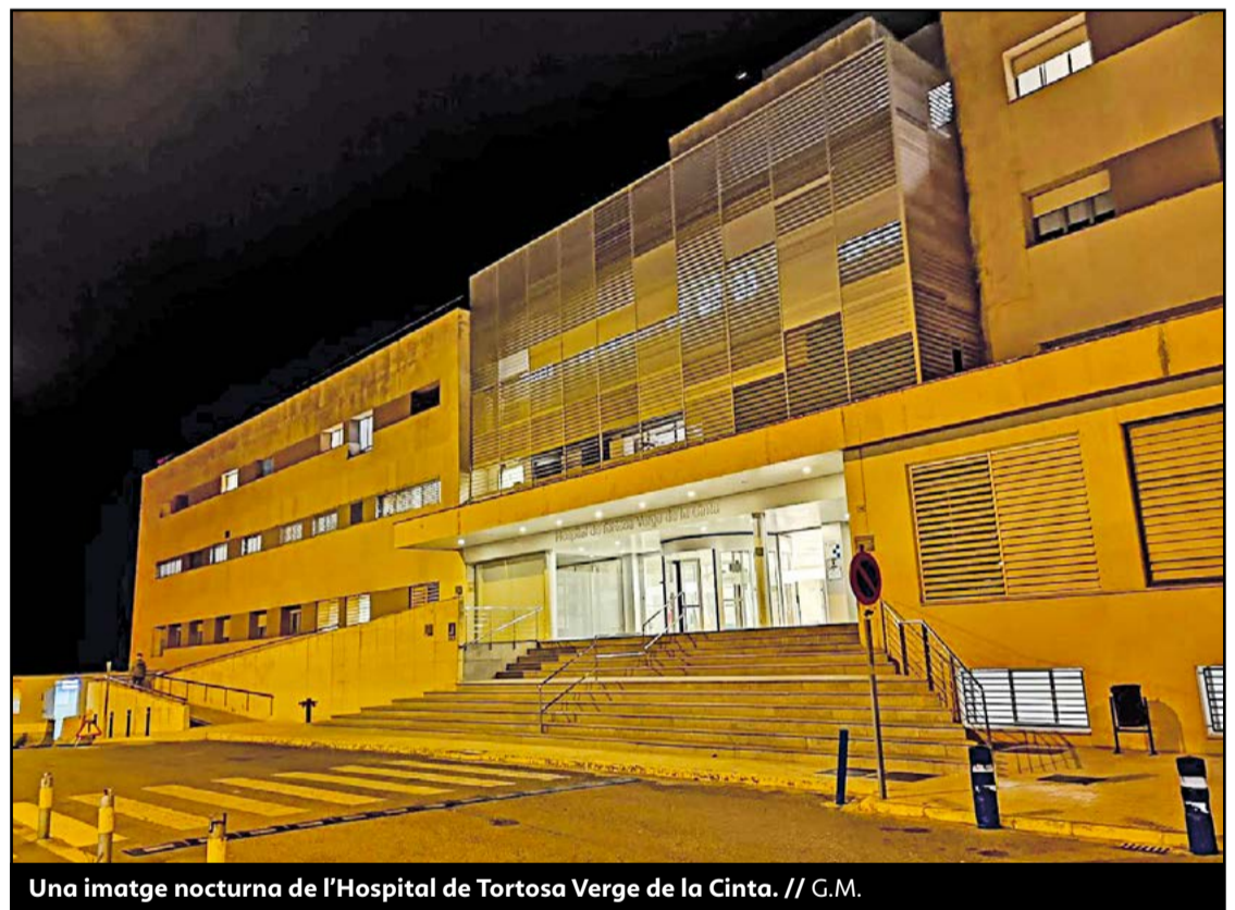
Una imatge nocturna de l'Hospital de Tortosa Verge de la Cinta.