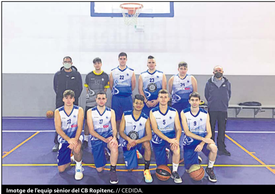
Imatge de l'equip sènior del CB Rapitenc.

● La competició tornarà el proper mes de gener, segons va anunciar la Federació Catalana