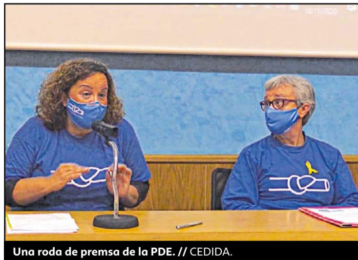
Una roda de premsa de la PDE.