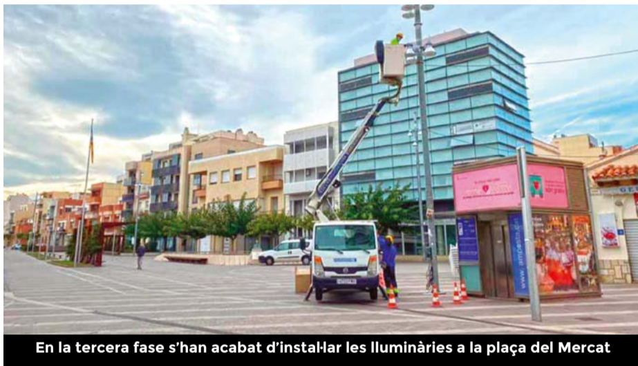
En la tercera fase s'han acabat d'instal·lar les lluminàries a la plaça del Mercat

tament espera complir amb la data i el 2021 haver canviat tot el sistema de l'enllumenat de la ciutat per un sistema més eficient, que generi menys consum i que sigui respectuós per al medi ambient. Tot plegat per fer d'Amposta una ciutat sostenible.