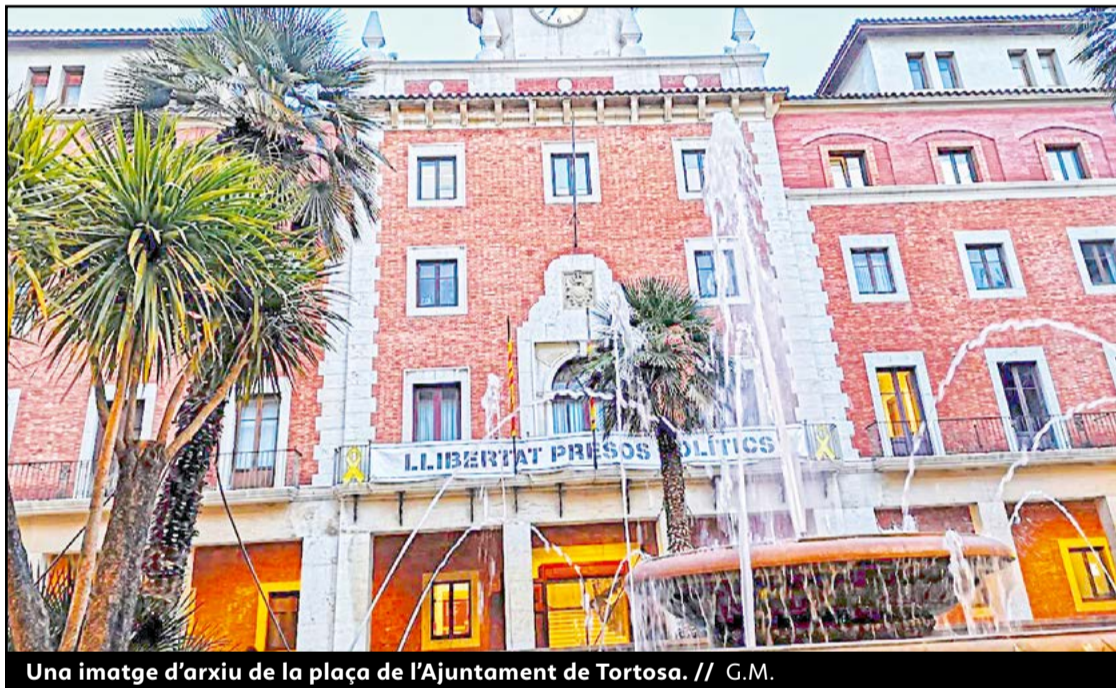
Una imatge d'arxiu de la plaça de l'Ajuntament de Tortosa.

A banda de la subvenció per a la reforma de la plaça d'Espanya, l'Ajuntament de Tortosa també ha obtingut del PAM de la Diputació un total de 190.581,72 euros per a despeses corrents. Estos recursos servirán per dur a terme actuacions de manteniment a la via pública, renovació d'equipaments o de mobiliari urbà al llarg de quatre anualitats. ●