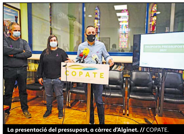
La presentació del pressupost, a càrrec d'Alginet. // COPATE.