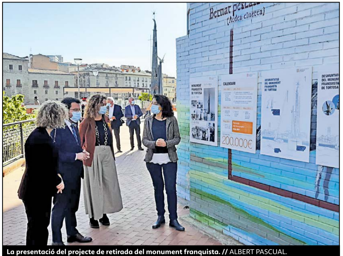
La presentació del projecte de retirada del monument franquista. // ALBERT PASCUAL.