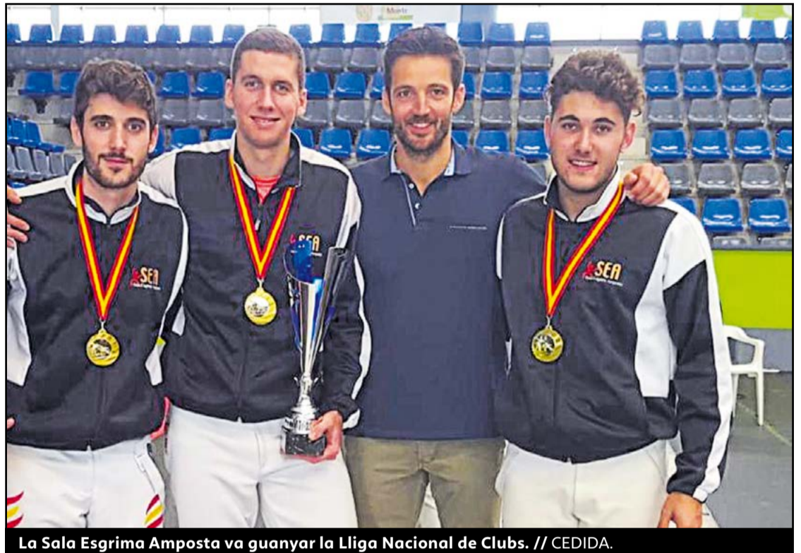
La Sala Esgrima Amposta va guanyar la Lliga Nacional de Clubs.

Cal remarcar que la Federació Espanyola d'Esgrima va crear un sistema de competició molt segur i tots els protagonistes de la competició van ser acreditats i se'ls va realitzar un examen abans d'accedir a les instal·lacions de Las Gaunas. Després de la competició celebrada a terres riojanes, el calendari seguirà amb la disputa del Campionat d'Espanya absolut, sub'23 i sub'20 a Madrid, aquest mes de desembre. Allí, la Sala també serà favorita. ●