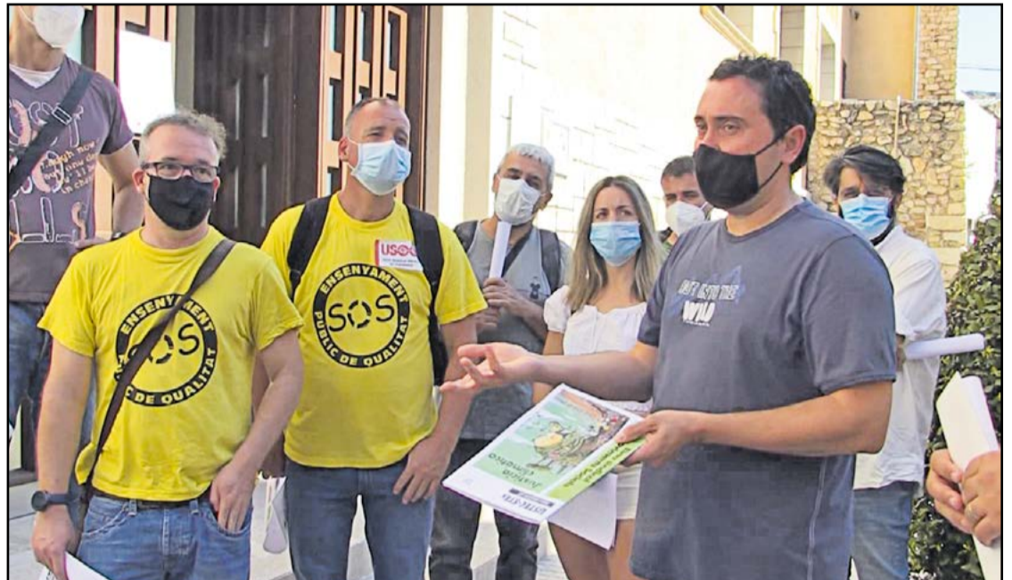
Un moment de la protesta dels sindicats d'ensenyament, el primer dia del nou curs. // C21.