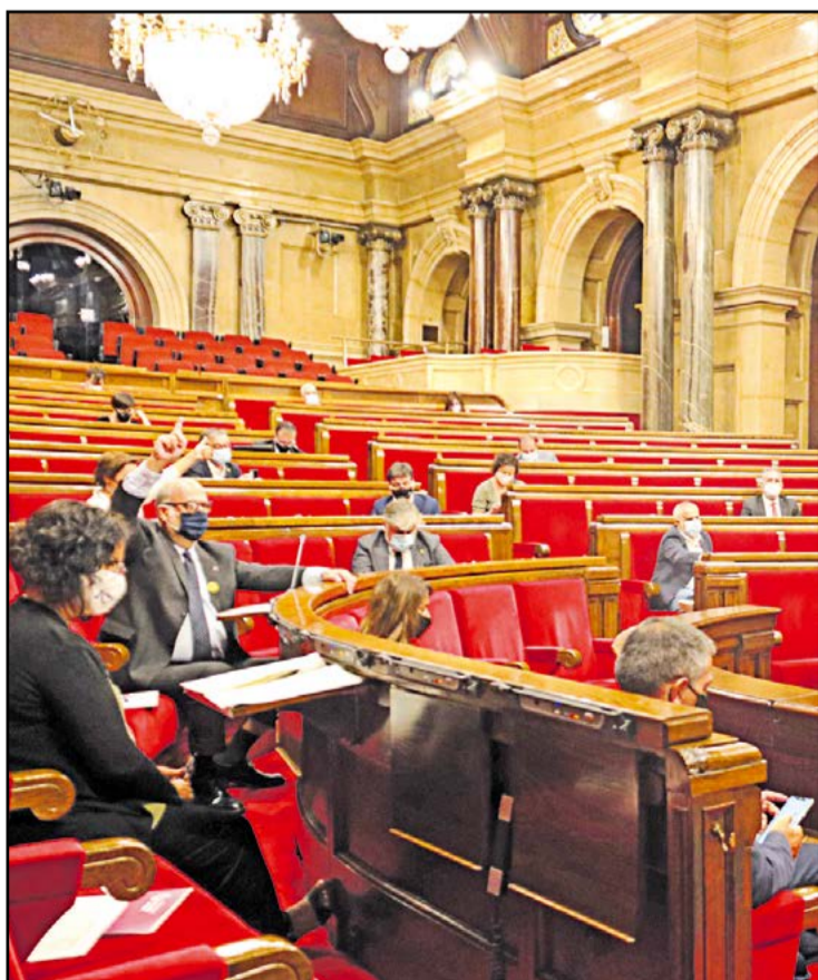
El debat de política general del 18 de setembre.

● Junts i ERC, amb l'abstenció del PP, eviten també comprometre's a crear l'ATM de l'Ebre