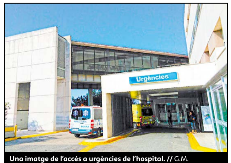
Una imatge de l'accés a urgències de l'hospital.

ENS DEDIQUEM A LA PREVENCIÓ , DETECCIÓ I TRACTAMENT DELS PROBLEMES VISUALS I AUDITIVS .