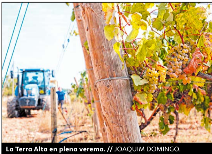
La Terra Alta en plena verema.