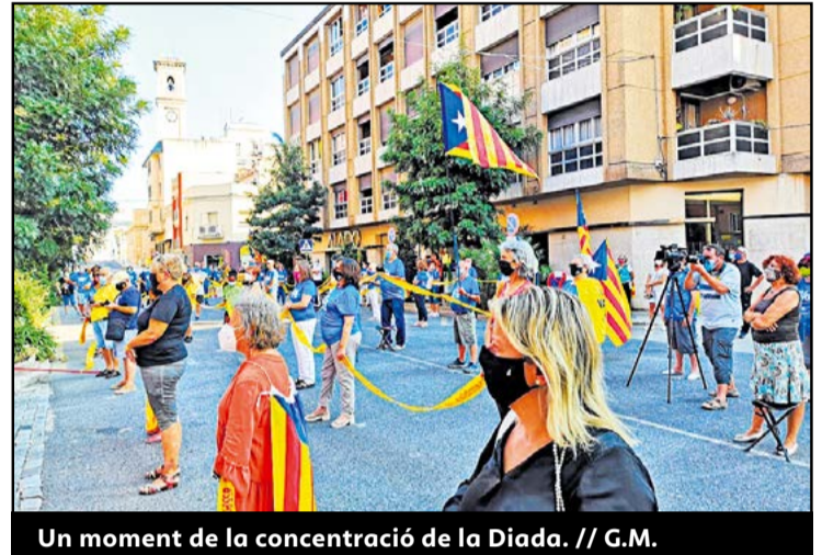
Un moment de la concentració de la Diada.