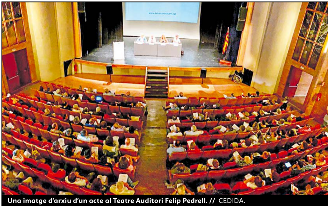
Una imatge d'arxiu d'un acte al Teatre Auditori Felip Pedrell.