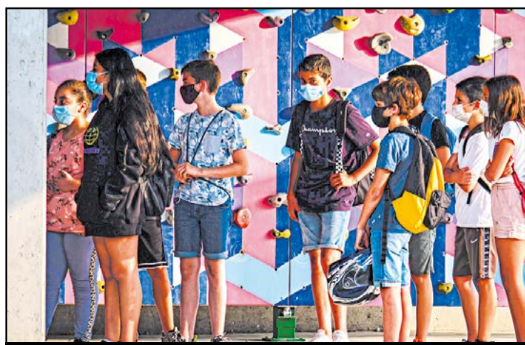
Un grup d'alumnes amb mascaretes, a punt d'entrar. // J. D.