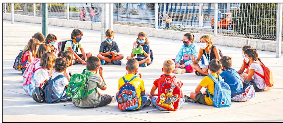
En rotllana amb la mestra, al pati de l'escola.