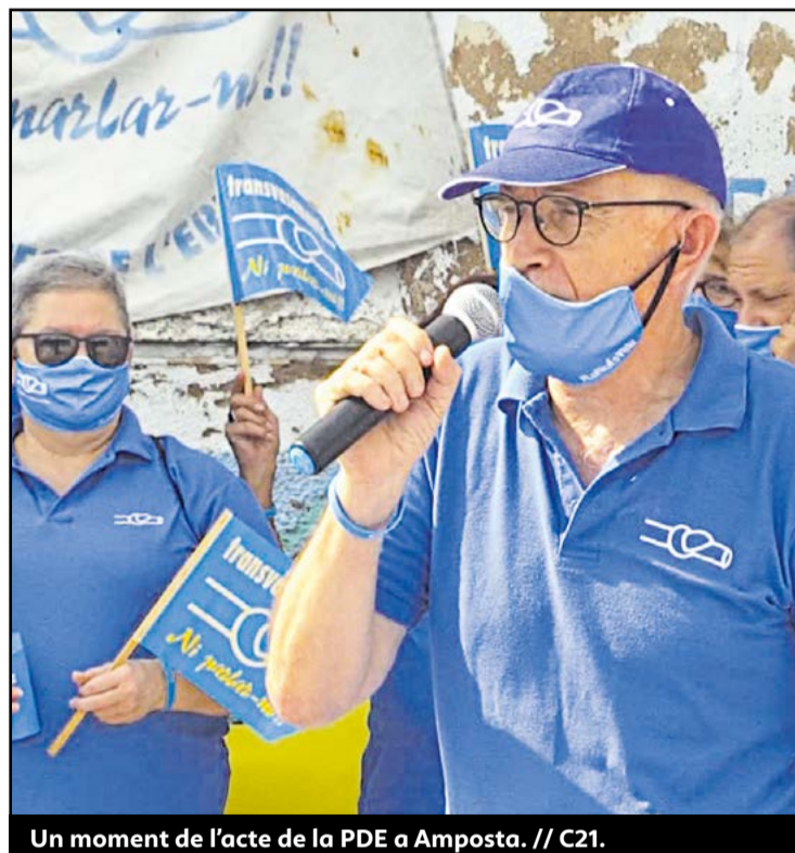
Un moment de l'acte de la PDE a Amposta. // C21.