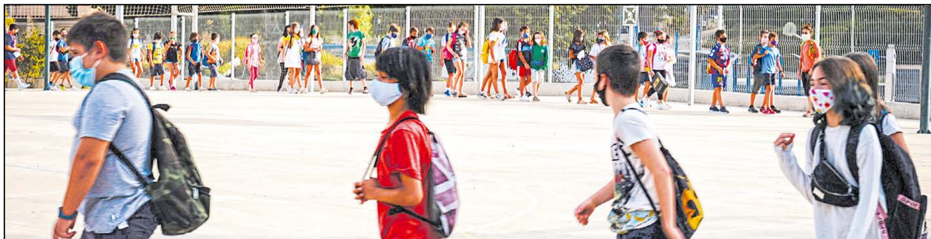
En filera pel pati, abans d'entrar a les aules.