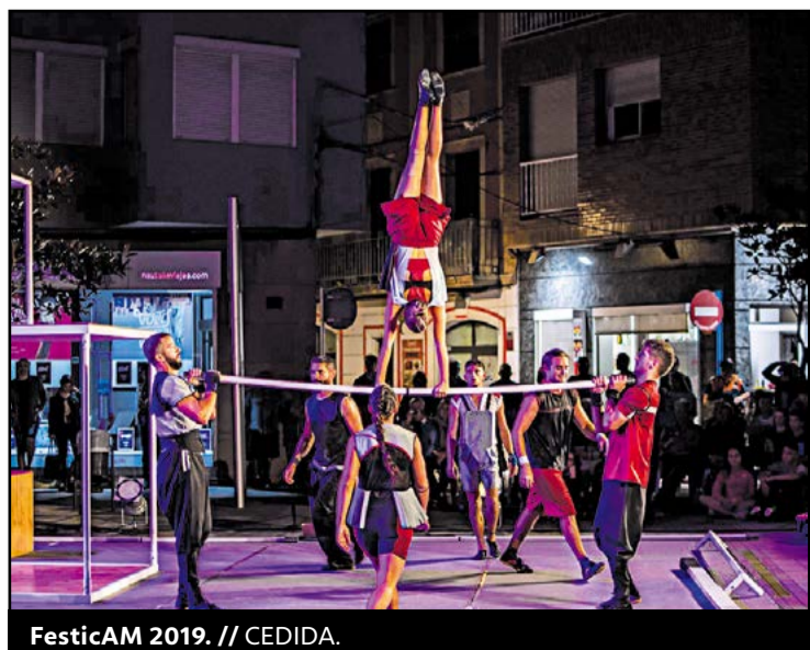
FesticAM 2019.