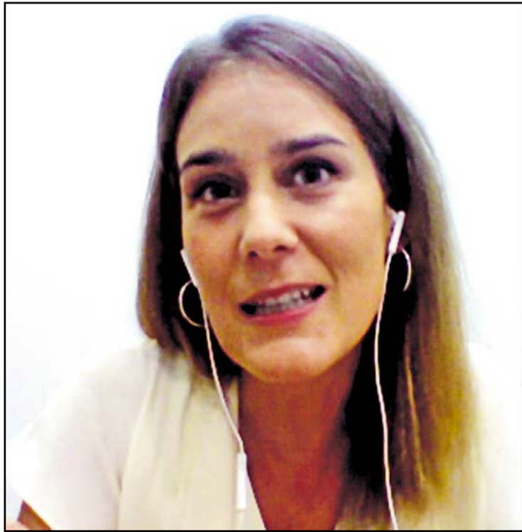
Jéssica Albiach, durant l'entrevista a Canal 21 Ebre.

● La presidenta de Catalunya en Comú Podem creu que la crisi obligava a fer eleccions ara