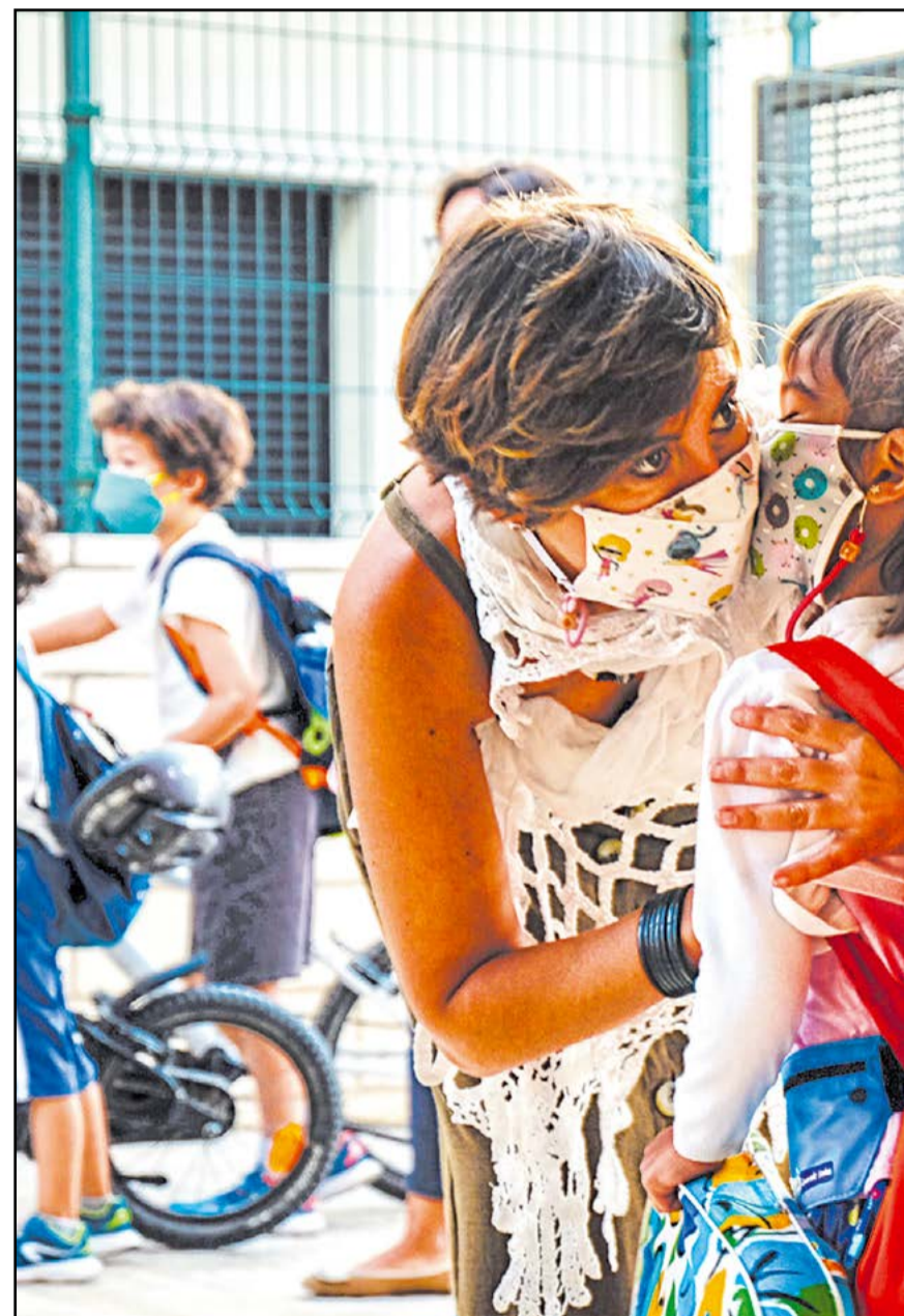
L'últim petó abans d'entrar a l'escola.