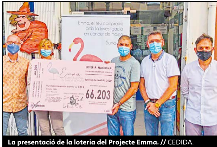
La presentació de la loteria del Projecte Emma.

El Projecte Emma, el projecte de recerca impulsat des de diferents entitats de les Terres de l'Ebre per investigar el càncer de mama, ha reprès les accions per captar fons i poder finalitzar l'estudi en el qual participen unes 300 dones. Presentat públicament el passat mes de gener, la crisi del coronavirus ha obligat a aturar les activitats i obligarà a retardar el calendari previst. Però ara han presentat un torró, números de loteria i organitzaran partits de futbol, entre d'altres iniciatives. L'objectiu és aconseguir 150.000 euros durant els propers mesos,