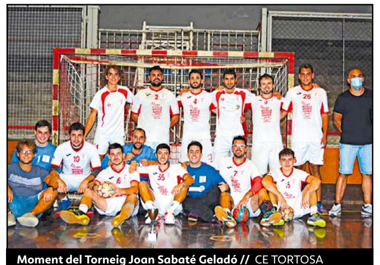
Moment del Torneig Joan Sabaté Geladó // CE TORTOSA

Tot i que la campanya es presenta complicada per la pandèmia, des de l'entitat de la capital del Baix Ebre esperen que els seus equips puguin disputar amb normalitat les respectives lligues que s'iniciaran en breu i que afrontaran amb il·lusió. ●