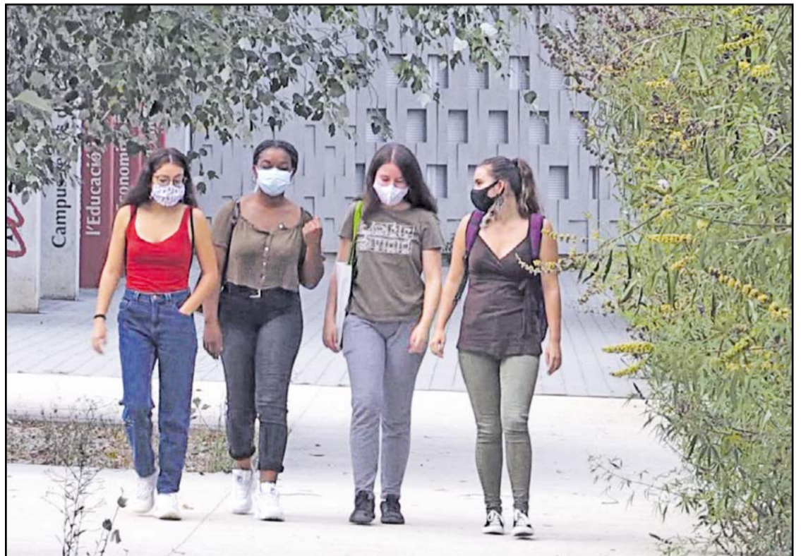
Un grup d'alumnes passegen pel campus de la URV a les Terres de l'Ebre. // C21.