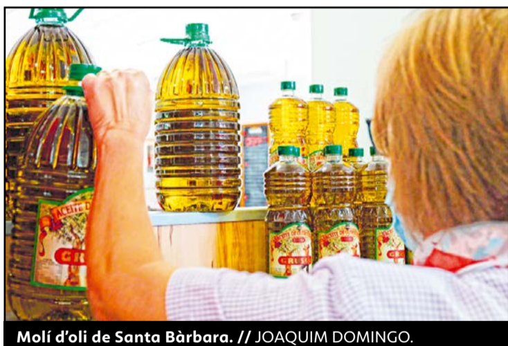
Molí d'oli de Santa Bàrbara. // JOAQUIM DOMINGO.