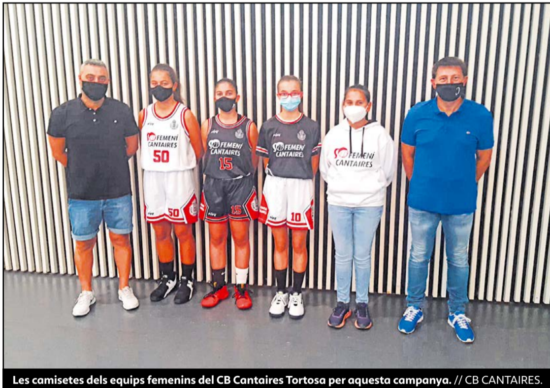
Les camisetes dels equips femenins del CB Cantaires Tortosa per aquesta campanya.

● El club va presentar el Femení Cantaires, amb el que es vol potenciar aquesta parcel·la