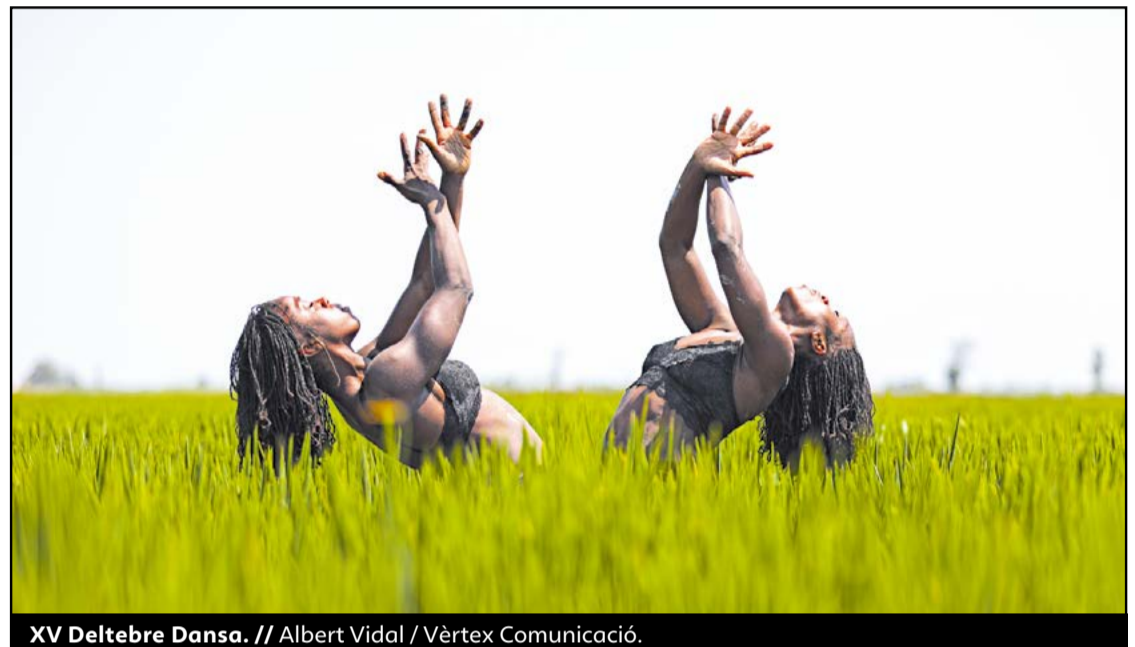
XV Deltebre Dansa.

Entre els guardonats del Festival també destaca el documental Our Gorongosa del director James Byrne que s'ha endut el premi a la Millor pel·lícula de promoció de la sostenibilitat. El film, enregistrat al Parc Nacional de Gorongosa, a Moçambic, se-