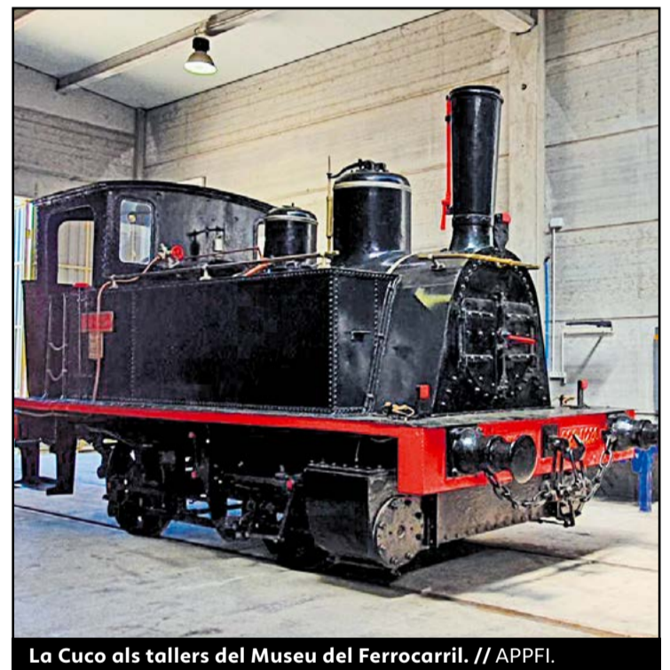
La Cuco als tallers del Museu del Ferrocarril. // APPFI.