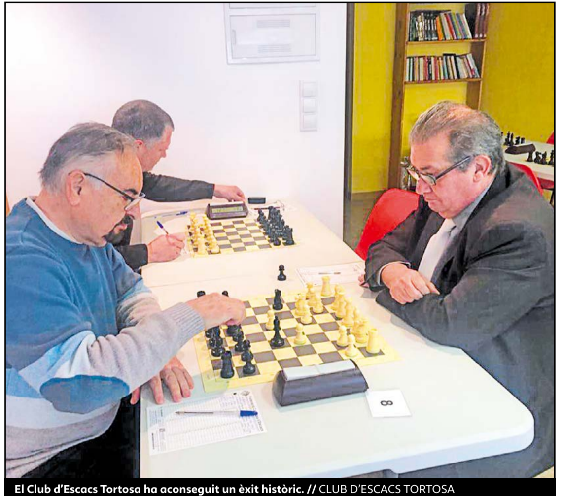
El Club d'Escacs Tortosa ha aconseguit un èxit històric.