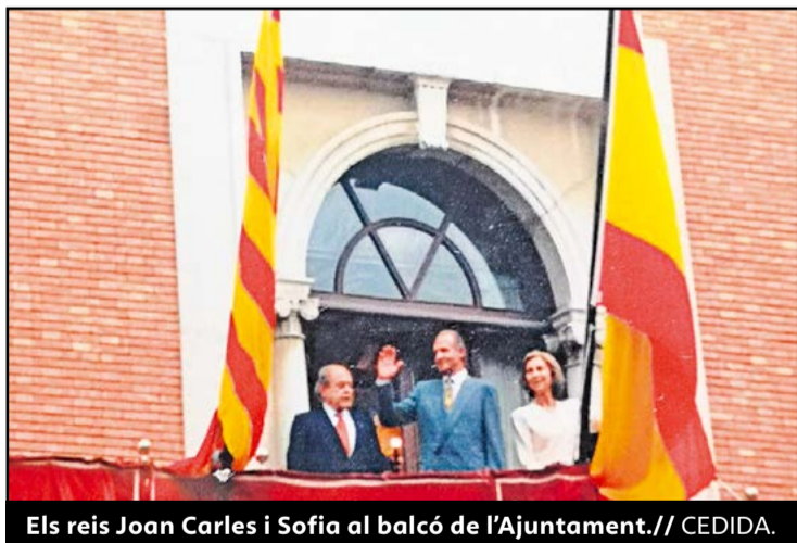
Els reis Joan Carles i Sofia al balcó de l'Ajuntament.