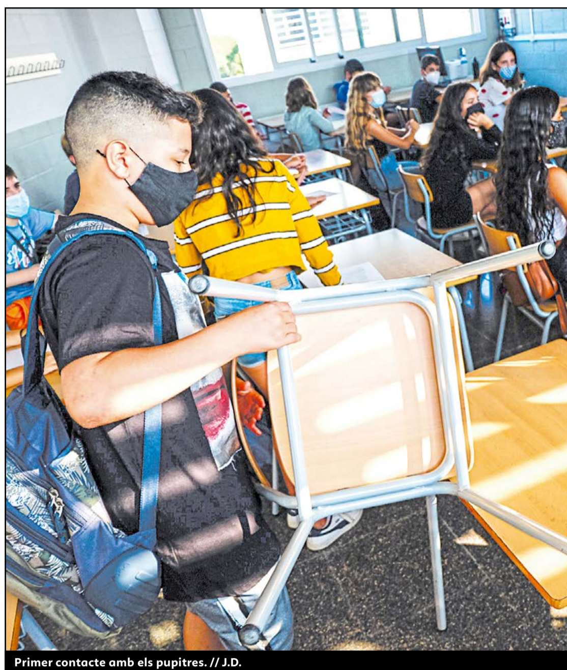
Primer contacte amb els pupitres. // J.D.