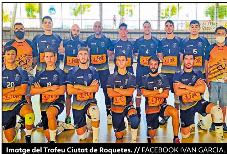
Imatge del Trofeu Ciutat de Roquetes.