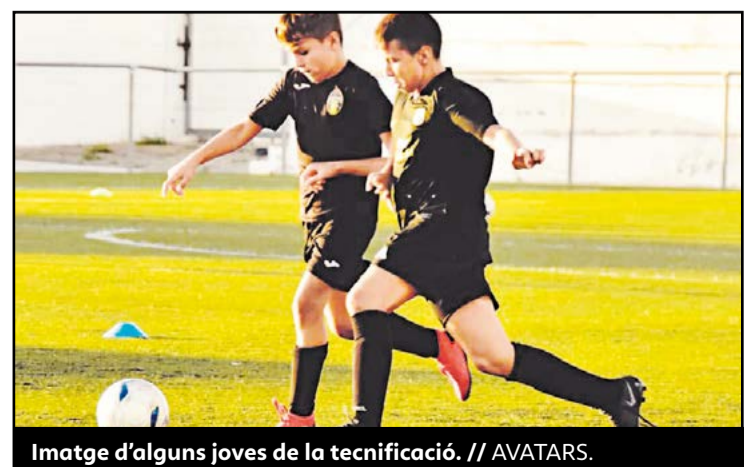
Imatge d'alguns joves de la tecnificació.

Per acabar la campanya, es celebrarà el dotzè Campus Internacional de Futbol Avatars Academy del 21 al 26 de juny del 2021, un event molt important que s'ha anat consolidant amb el pas del temps i que sempre aixeca molt d'interès. ●