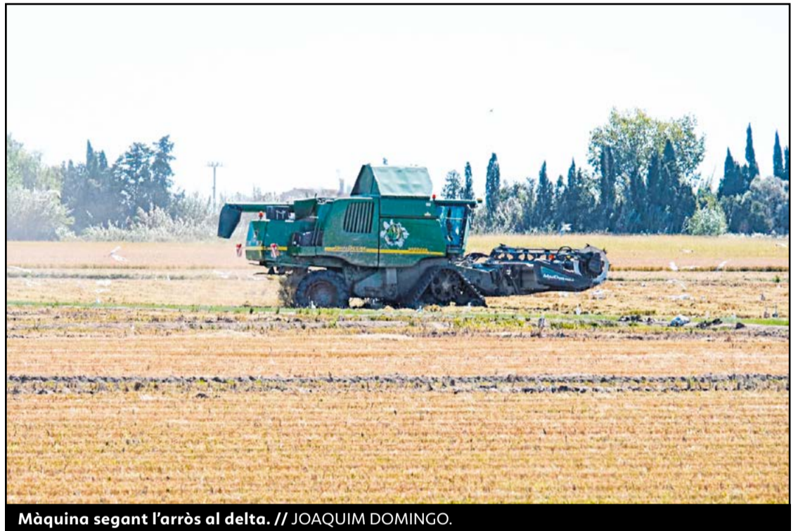
Màquina segant l'arròs al delta. // JOAQUIM DOMINGO.