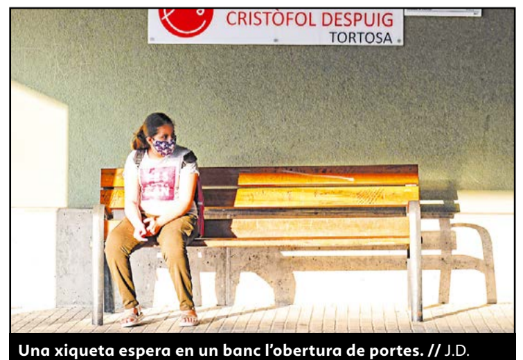
Una xiqueta espera en un banc l'obertura de portes.