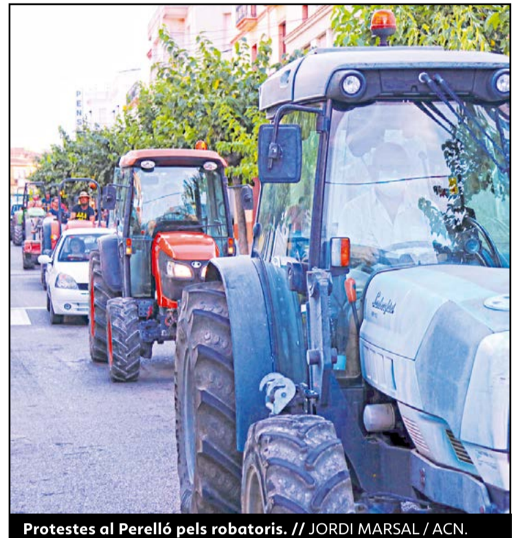
Protestes al Perelló pels robatoris.