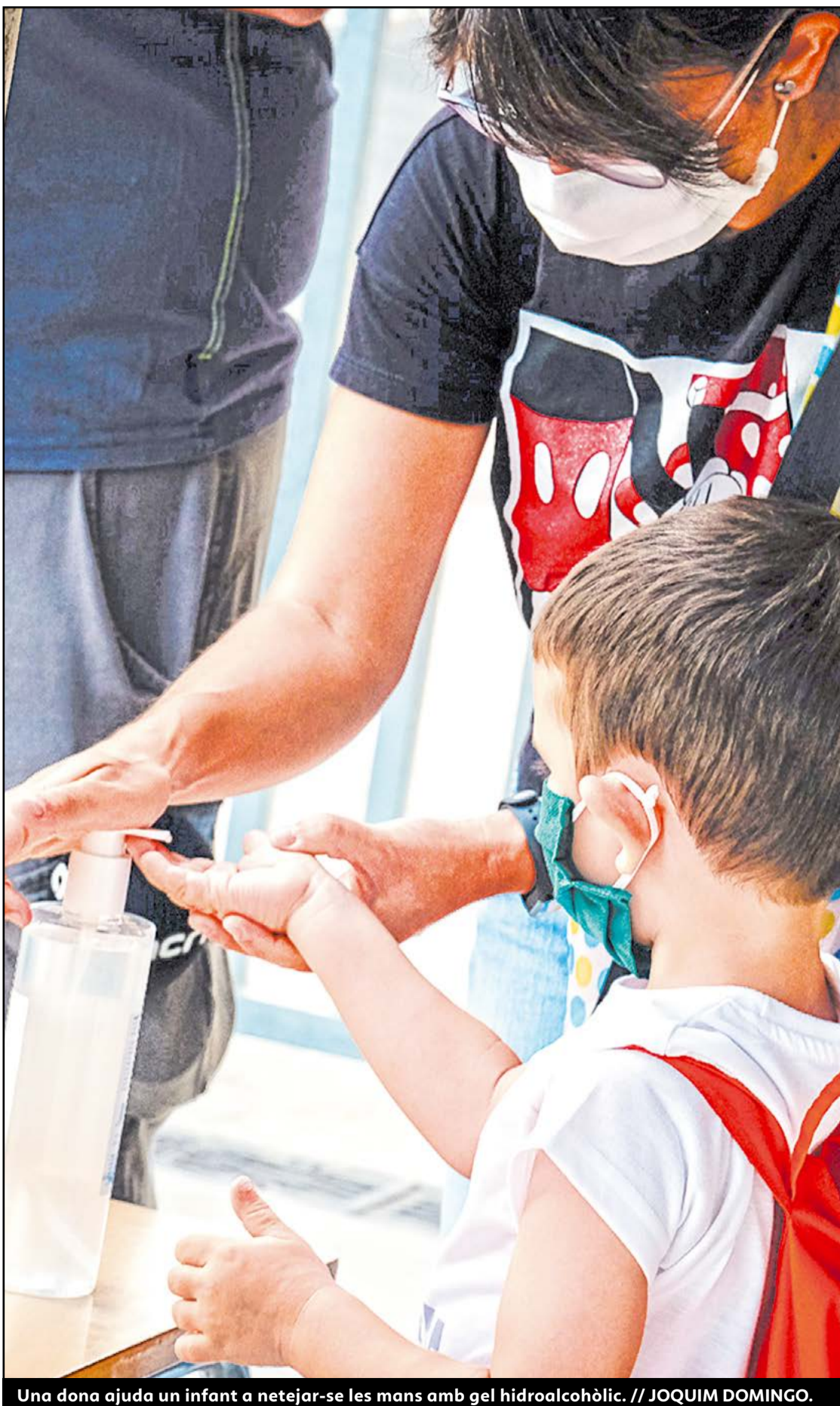
Una dona ajuda un infant a netejar-se les mans amb gel hidroalcohòlic. // JOAQUIM DOMINGO.