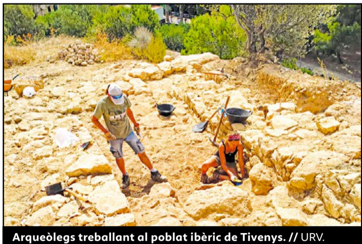
Arqueòlegs treballant al poblat ibèric de Tivenys.