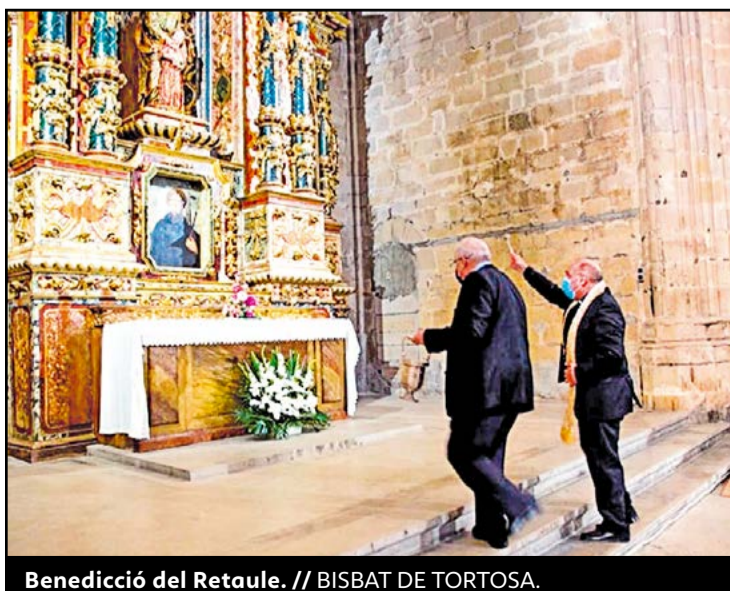
Benedicció del Retaule. // BISBAT DE TORTOSA.