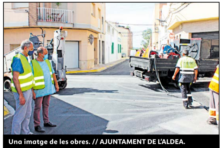
Una imatge de les obres.