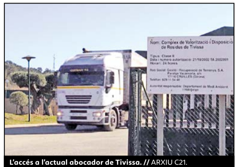
L'accés a l'actual abocador de Tivissa.

de valorització i dipòsit controlat de residus de Tivissa, i que no se n'autoritze l'ampliació. Segons UP, el projecte d'ampliació pot afectar més de 690.000 metres quadrats de finques agrícoles i altres terrenys agrícoles adjacents. A més, tampoc té en compte el criteri de proximitat en la gestió de residus, ja que es preveu la necessitat de l'ampliació per rebre residus generats fora de les Terres de l'Ebre, com ara els procedents del buidat de l'abocador industrial de Vacamorta. ●