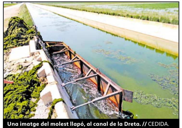
Una imatge del molest llapó, al canal de la Dreta.

sen ja la meitat del pressuposts. Segons les comunitats, tot i que el problema existeix des de fa molt de temps, en els últims anys s'ha agreujat i en aquests moments ja resulta "desbordant". Adueixen que el llapó ha causat, en bona mesura, la reducció dels cabals concessionals als canals principals, cosa que ha obligat a aplicar restriccions en el reg en els últims dies per garantir la disponibilitat d'aigua en tota la zona regable quan els camps d'arròs necessiten estar inundats. ●