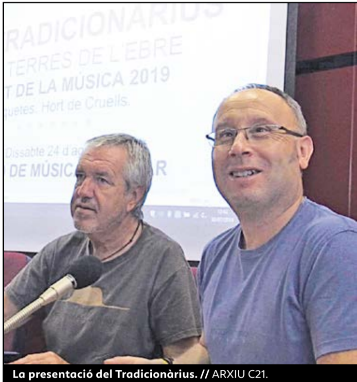
X.LL. / G.M. ROQUETES

● L'edició es clourà el 13 i 14 de setembre amb una exposició i un concert homenatge a Pete Seeger