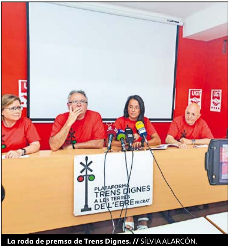
La roda de premsa de Trens Dignes.

● Trens Dignes desconfia de la nova data perquè entre en funcionament la doble via del Corredor