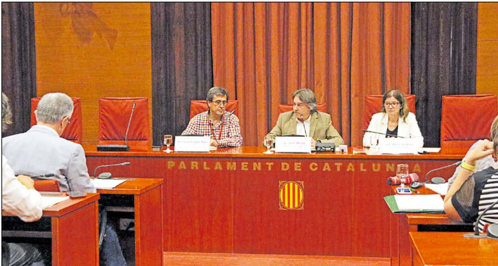
Un moment de la compareixença del periodista de Público davant de la comissió d'investigació del Parlament.