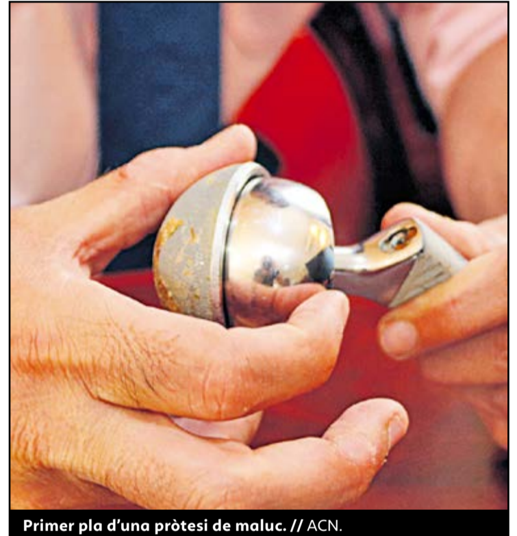
Primer pla d'una pròtesi de maluc.

Les actuacions de l'Audiència Nacional neixen d'una querrela que un grup de 63 afectats (inicialment 43) va presentar fa gairebé dos anys. ●