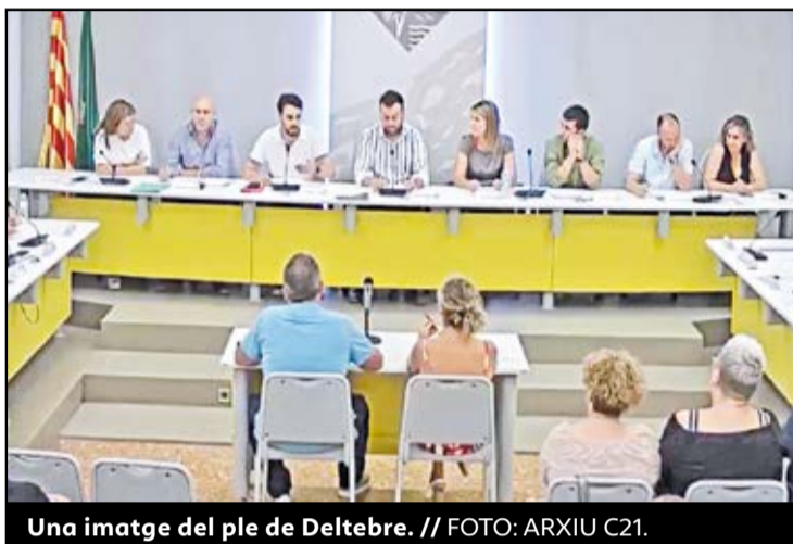
Una imatge del ple de Deltebre.

● L'alcalde només cobrarà per assistències i tindrà una retribució màxima anual de 19.600 euros