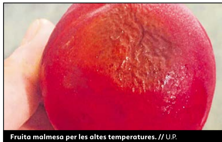
Fruita malmesa per les altes temperatures.

només es detecten al camp, sinó que apareixen també a l'hora de manipular la fruita, ja que a les peces danyades pel cop de calor se'ls desprèn fàcilment la pell. En cas de confirmar-se pèrdues de més del 30% de la mitjana a la Ribera d'Ebre, al Baix Segrià o en altres zones de Catalunya, el sindicat sol·licitarà que s'articulin mesures fiscals i financeres per a les explotacions més afectades i amb caràcter d'urgència. ●