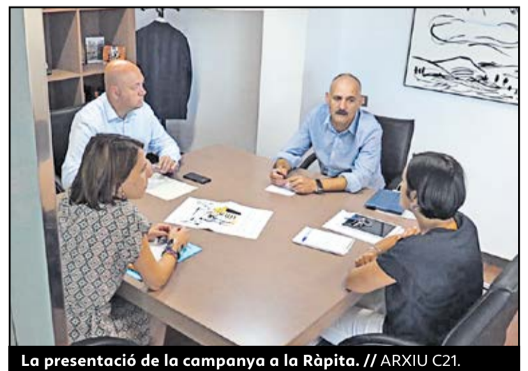
La presentació de la campanya a la Ràpita.