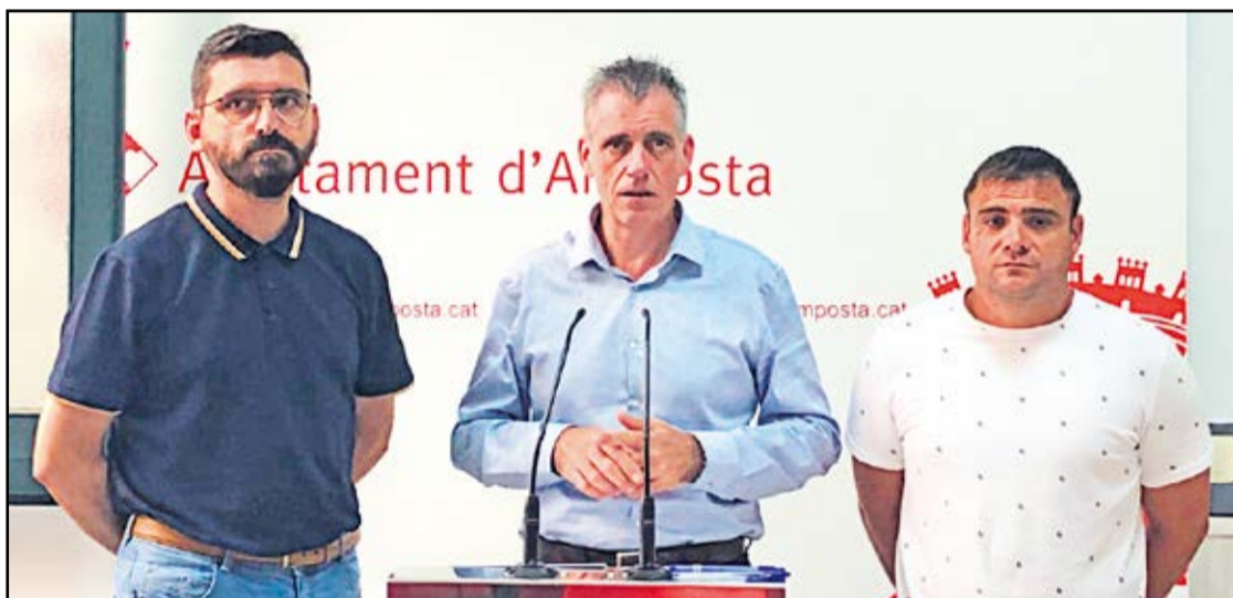
La presentació del programa de festes d'Ampostà.

Actes com el concert de Melendi del dia 14 amb més de 4.000 entrades venudes, o les actuacions de Joan Rovira, La Clandestina o la cantant ampostina Keila. Nits d'orquestra, el concert de bandes o el tradicional concurs nacional de vestits de paper completen una extensa programació amb activitats per a tots els públics. Bel ha assenyalat que "la plaça de l'Ajuntament posarà en relleu les activitats tradicionals de casa nostra, com pot ser el pregó, l'Ampostà Jota Viva, el Concert de Bandes". Així, en aquesta ubicació emblemàtica al centre del poble, s'inauguraran les festes amb el concert de música tradicional de les valencianes Sis Veus amb l'actuació "Els dies i les dones", el