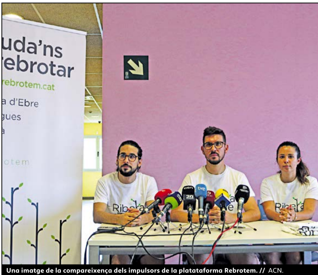
Una imatge de la compareixença dels impulsors de la plataforma Rebrotem.

El suport a la pagesia i la ramaderia seran les eines claus per fer rebrotar la Ribera d'Ebre. La consellera d'Agricultura, Teresa Jordà, ja va avançar que cal recuperar la ramaderia extensiva i establir reg de suport en zones afectades per la sequera, amb mesures consensuades amb la gent del territori. De fet, durant l'incendi ja es va poder comprovar que les zones amb cultius van fer de barrera contra el foc, amb parts dins del perímetre del foc que no es van veure afectades per les flames. Amb tot, la Federació de Cooperatives Agràries de Catalunya estima que l'incendi va arrasat un miler d'hectàrees de cultius, un 80% d'oliveres i un 20% d'ametllers. L'entitat calcula que les set cooperatives patiran una reducció de la producció d'entre un 10 i un 45%, amb pèrdues superiors als 4 milions d'euros en la collita dels propers tres anys. ●