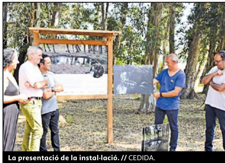
La presentació de la instal·lació.

SI EM VEUS, FUNCIONA. comercial@doblecolumna.com