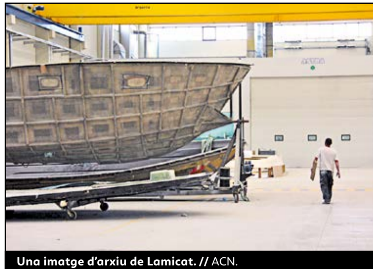
Una imatge d'arxiu de Lamicat.

La instal·lació de Lamicat a Amposta va ser una aposta de l'anterior govern municipal de CiU que va acabar fracassant, tot i el suport de la Generalitat al sector de la fabricació de compòsits. Quan l'empresa va entrar en concurs de creditors després del 2013, tant la nau com els terrenys van quedar en mans del Banc de Sabadell. ●