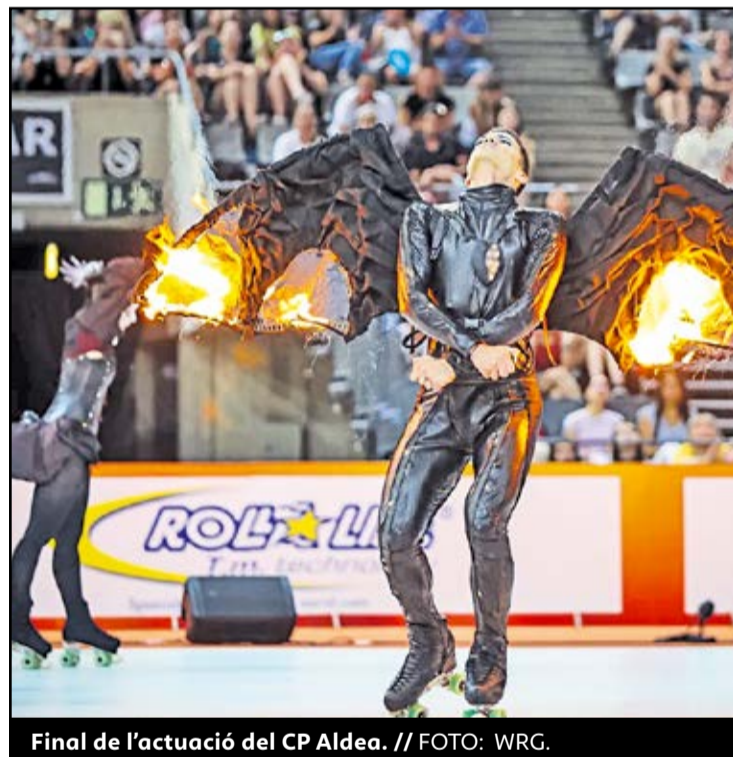
Final de l'actuació del CP Aldea.