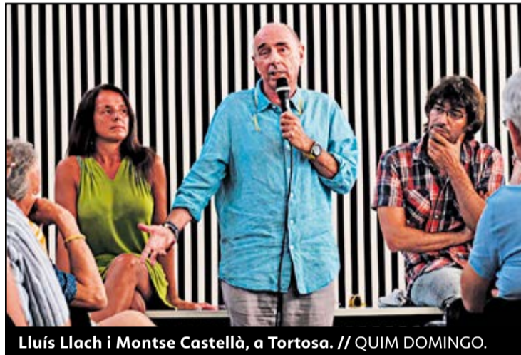
Lluís Llach i Montse Castellà, a Tortosa.

El Centre Cívic de Ferreries, a Tortosa, va ser l'escenari escollit per presentar, el 15 de juliol, la implantació del Debat Constituent a les Terres de l'Ebre. L'anomenat Consell Assessor per a l'Impuls del Fòrum Cívic i Social pel Debat Constituent era fins al 22 de juliol un òrgan autònom i provisional, per impulsar un procés de debat constituent en què la societat civil i la ciutadania, des de l'autoorganització i una participació transversal i plural, pot definir les bases constitucionals del futur polític de Catalunya. El president del consell, Lluís Llach, va ser l'encarregat de