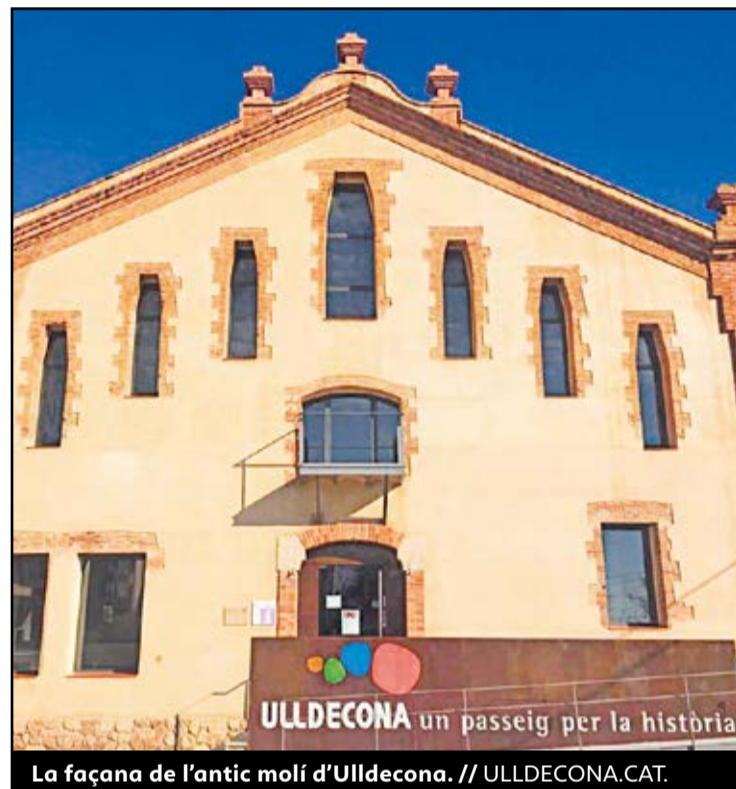
La façana de l'antic molí d'Ulldecona.

zació del carrer Major, accés des de Tortosa, i dels carrers Amposta i Pare Palau. El procediment complet consta de 3 lots amb un pressupost total de 91.791,30 euros. El primer representa la contractació de la pavimentació i s'hi van presentar dos empreses, resultant adjudicatària Auxiliar de Firmes y Carreteras S.A., per valor de 47.880,91 euros. El segon lot és la contractació de millora de l'enllumenat públic. En aquest cas s'han presentat quatre propostes i l'adjudicatària ha estat l'empresa SECE, per 12.368,69 euros. Finalment, al lot 3, reparació de la xarxa de clavegueram del carrer Amposta i Pare Palau, hi optaven quatre empreses més i s'ha adjudicat a Vials i Asfaltats Independents, per valor de 30.541,50 euros. ●