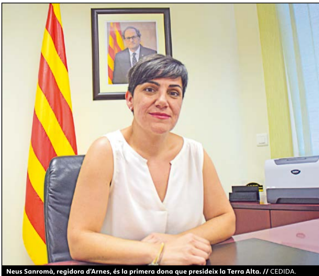
Neus Sanromà, regidora d'Arnes, és la primera dona que presideix la Terra Alta.