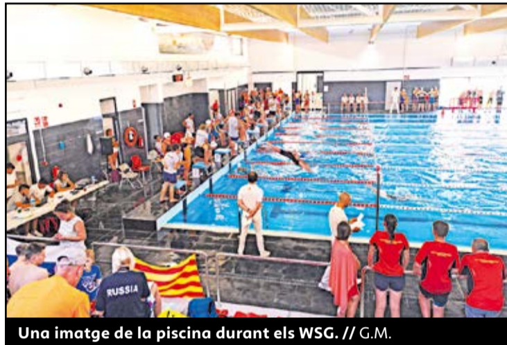
Una imatge de la piscina durant els WSG.