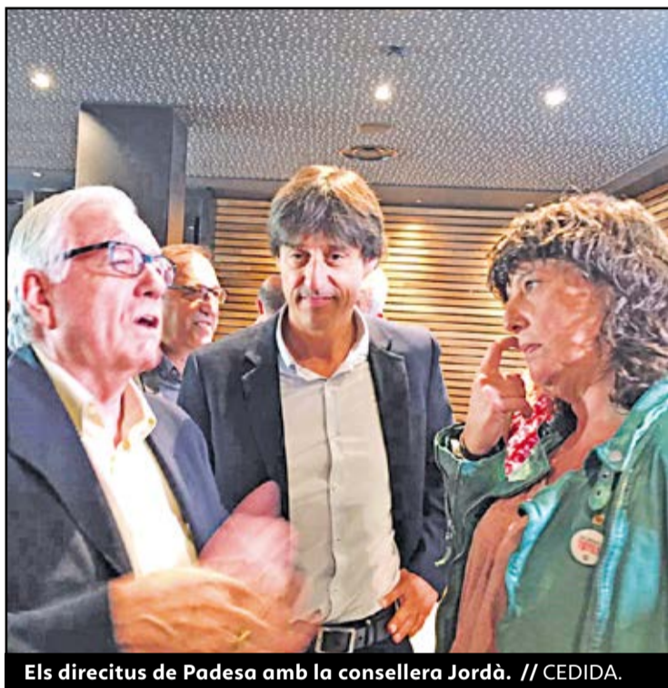
Els directius de Padesa amb la consellera Jordà.

● El grup té una facturació anual de 307 milions d'euros i una plantilla de 950 treballadors