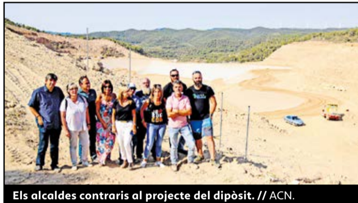
Els alcaldes contraris al projecte del dipòsit.

L'Ajuntament de Riba-roja d'Ebre va informar el 17 de juliol que el dipòsit de residus industrials no perillosos ja està en disposició de començar a operar. Segons el consistori, l'empresa Lestaca ha presentat la declaració responsable a l'Agència de Residus de Catalunya (ARC) i dona comptes d'haver complert amb tots els requeriments de l'autorització ambiental, que expirava el mateix 17 de juliol. Les obres, per tant, s'han fet en tres mesos, tot i ser un projecte amb més d'onze anys de tramitació. A més, cal tenir en compte que tant el Departament de Terri-