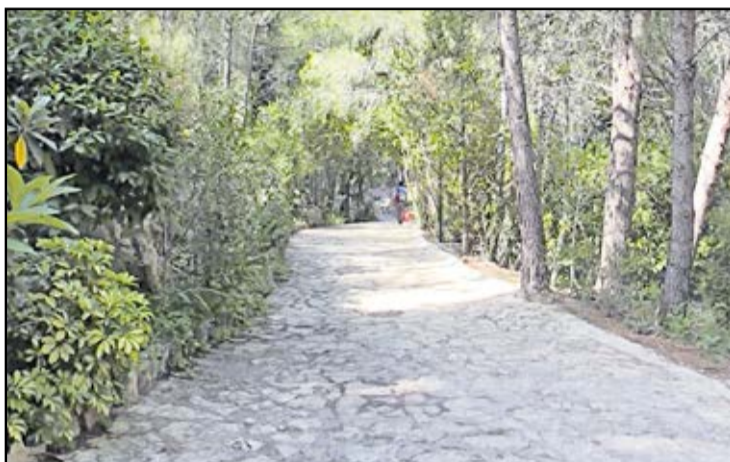
L'accés a les Coves Meravelles de Benifallet. // C21.

● L'Aldea adapta les instal·lacions de l'Esplai 4 Torres per facilitar l'accessibilitat del petit Ian