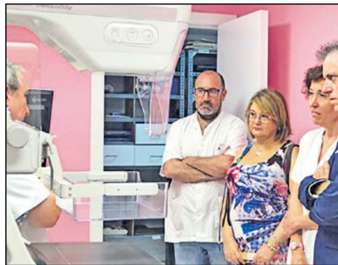
La nova unitat de mamografia d'Amposta.

L'Hospital Comarcal d'Amposta ha estrenat, aquest mes de juliol, la nova unitat de mamografia digital, que substitueix el que ja hi havia al centre en funcionament des de l'any 2007. Com en el cas de l'hospital de Tortosa, també es tracta d'una donació de la Fundació Amancio Ortega. En este sentit, l'aparell de mamografia digital, amb tomosíntesi i sistema de biòpsia esterotàxica, millora substancialment no només la capacitat diagnòstica i la limitació de dosis d'irradiació, sinó també l'experiència que té la pacient durant la prova, ja que és més còmoda que l'anterior unitat. Amb la posada en funcionament del nou aparell, l'Hospital Comarcal ha aprofitat per fer