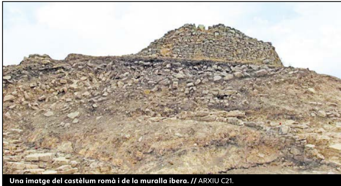
Una imatge del castèlum romà i de la muralla ibera.