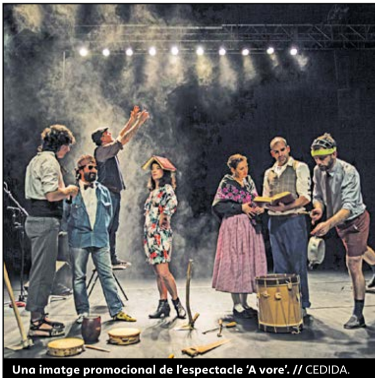
Una imatge promocional de l'espectacle 'A vore'.

El concert sota les estrelles del mestre nord-americà de l'ambient William Basinski, a l'Observatori de l'Ebre serà un dels plats forts de la vuitena edició d'Eufònic, el festival d'arts sonores, visuals i digitals de les Terres de l'Ebre que tindrà lloc entre els pròxims 5 i 8 de setembre. De fet, Eufònic incorpora l'Observatori de Roquetes com a nou espai. Basinski hi presentarà el seu nou disc, 'One time out of time', creat a partir de sons d'un altre espai d'investigació astronòmica, el Caltech Observatory Wave de Califòrnia, generats per ones gravitacionals emeses per la col·lisió de dos