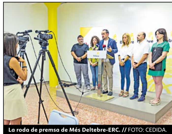
La roda de premsa de Més Deltebre-ERC.