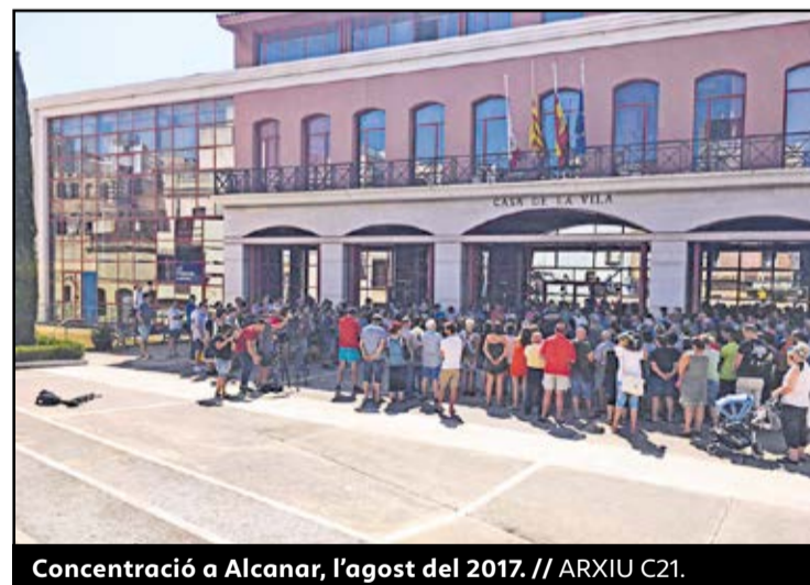
Concentració a Alcanar, l'agost del 2017.

dent del CNI. Roig considera una falta de respecte vers la ciutadania i, especialment les víctimes, el silenci per part del govern espanyol, per la qual cosa reclama la creació d'una comissió d'investigació. D'altra banda, l'Ajuntament d'Alcanar lamenta que la Fiscalia no reconegui les explosions d'Alcanar-Platja com a atemptat terrorista, tot i que s'hi preparaven explosius. "És una decisió errònia que deixa els veïns i veïnes desprotegits a l'hora de rebre les indemnitzacions", ha dit l'alcalde. ●