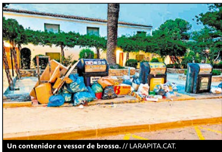
Un contenidor a vessar de brossa.