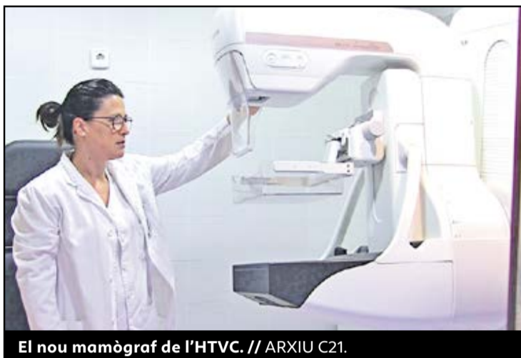
El nou mamògraf de l'HTVC.

● Des del juny, també es poden fer ressonàncies cardíaques, i es volen fer de mama i pediàtriques