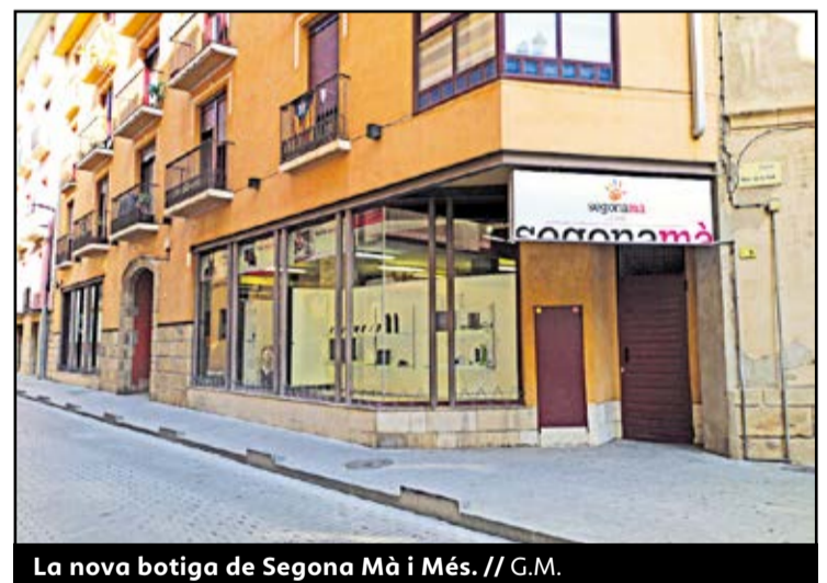
La nova botiga de Segona Mà i Més.