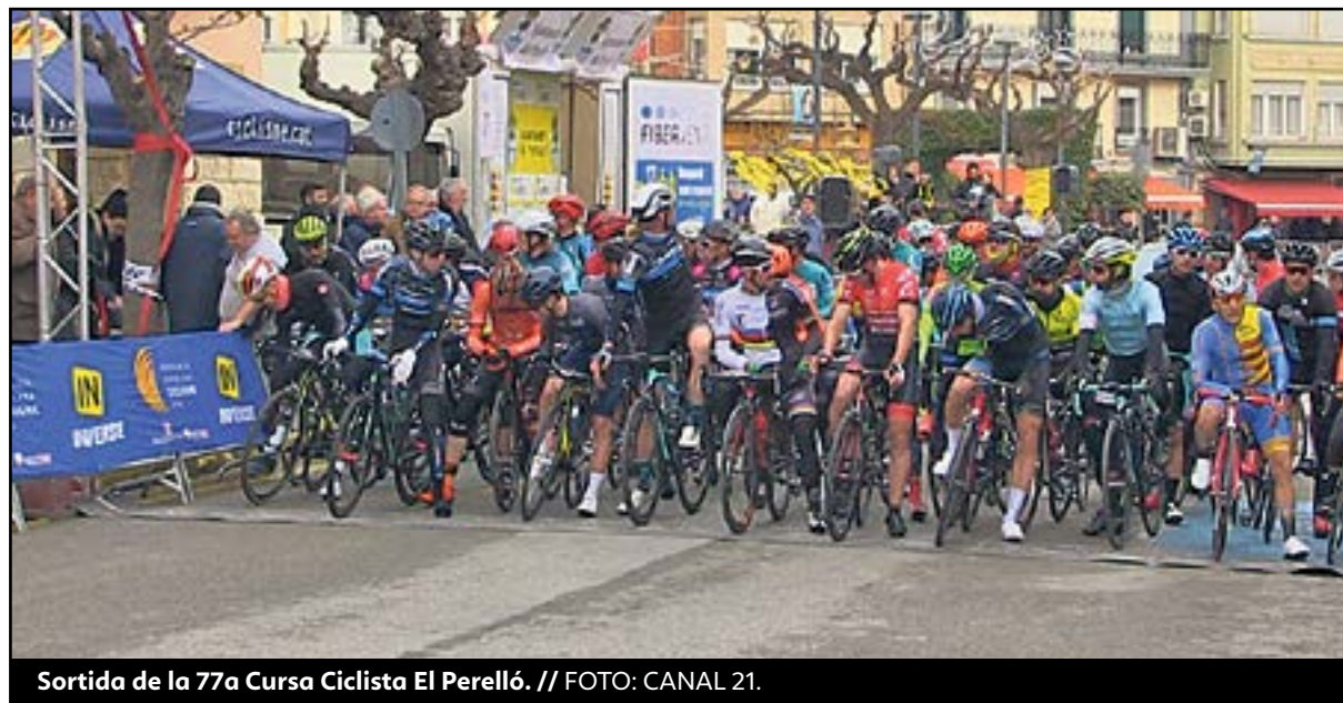
Sortida de la 77a Cursa Ciclista El Perelló.

Un total 51 participants inscrits repartits entre les categories