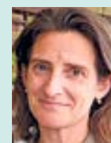
Teresa Ribera MINISTRA PER LA TRANSICIÓ ECOLÒGICA

Després d'anys de reivindicacions, el poble de Bítém ha aconseguit que l'Ajuntament de Tortosa i el Bisbat hagin acordat la compra-venda del Mas del Bisbe, un important element del patrimoni local i l'origen del poble.