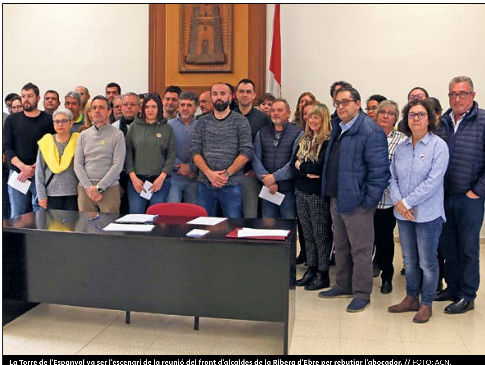
La Torre de l'Espanyol va ser l'escenari de la reunió del front d'alcaldes de la Ribera d'Ebre per rebutjar l'abocador.