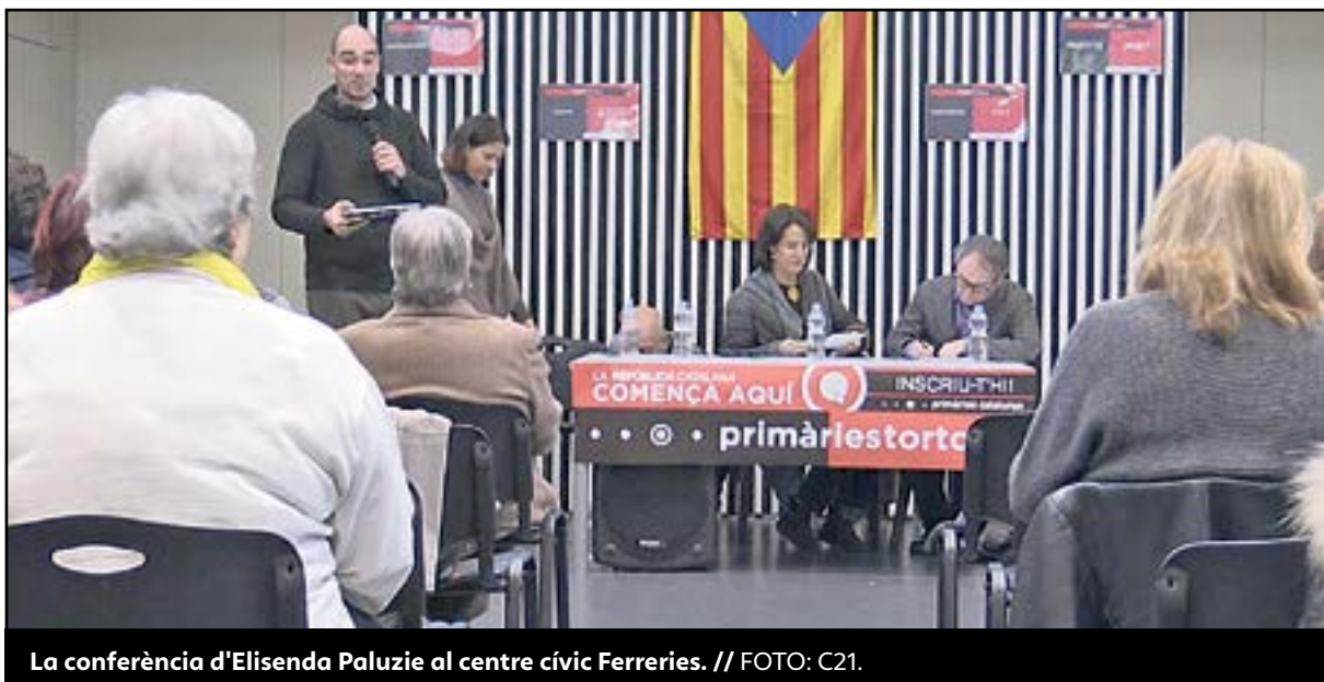
La conferència d'Elisenda Paluzie al centre cívic Ferreries.

D'altra banda, 19 de gener, Primàries Tortosa va fer un acte al centre cívic Ferreries, amb la presència de la presidenta de l'ANC, Elisenda Paluzie, qui va indicar que l'objectiu és maximitzar els vots independentistes. Un altre dels objectius és que les