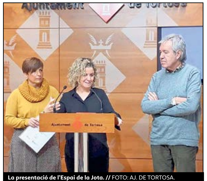
La presentació de l'Espai de la Jota.