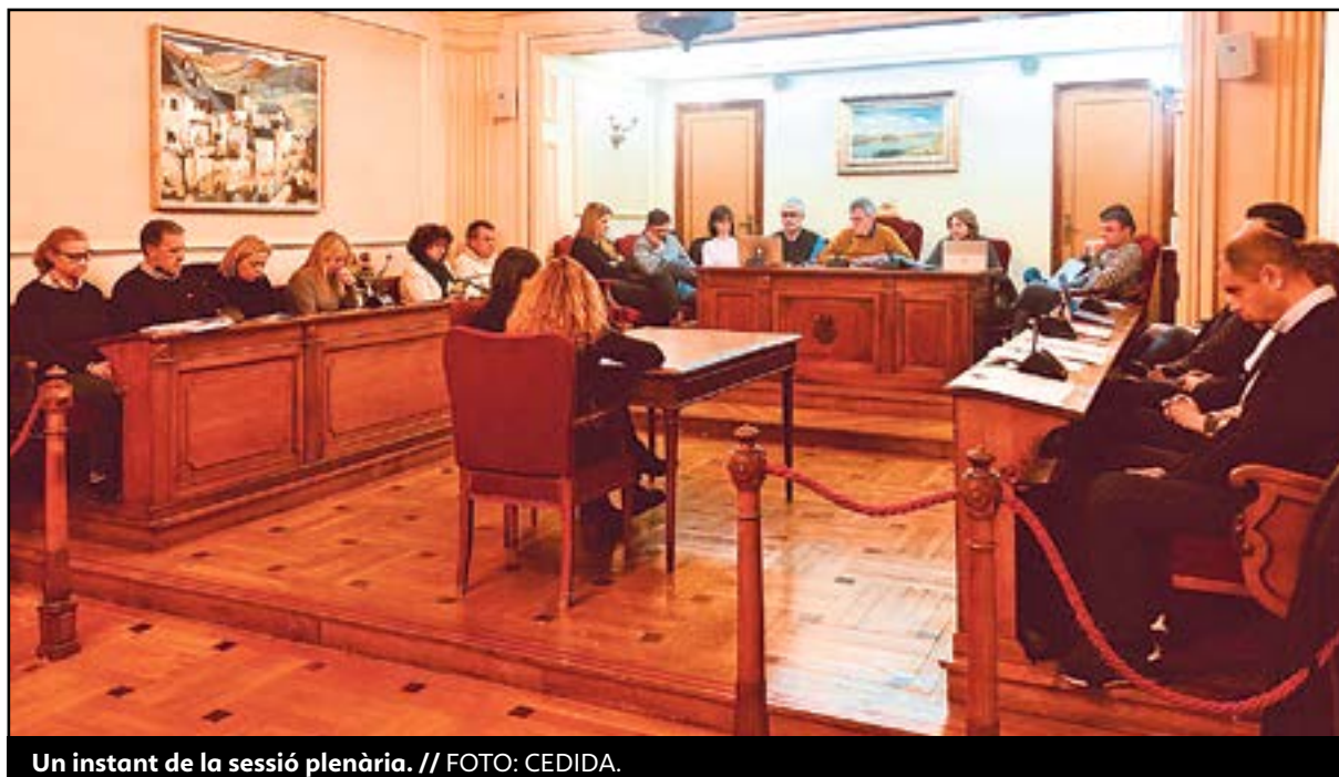
Un instant de la sessió plenària.

La societat començarà a gestionar la piscina i la neteja dels edificis municipals. Compta amb un capital social inicial de 50.000 euros. L'objectiu és consolidar la societat perquè vaja assumint serveis municipals quan acaben els contractes d'externalització. També es contractaran agents cívics i als entrenadors del Centre de Tecnificació a través d'aquesta empresa.