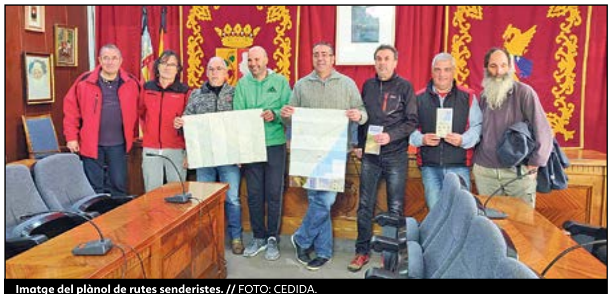
Imatge del plànol de rutes senderistes.