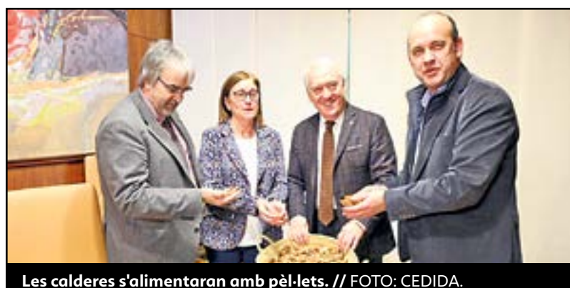
Les calderes s'alimentaran amb pèl·lets.