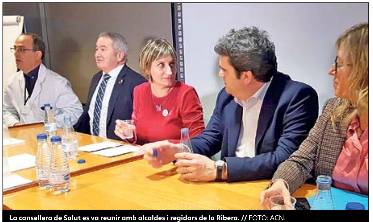
La consellera de Salut es va reunir amb alcaldes i regidors de la Ribera. // FOTO: ACN.

El Departament de Salut invertirà cinc milions d'euros durant els pròxims quatre anys per renovar les instal·lacions i equipaments tecnològics de l'Hospital Comarcal de Móra d'Ebre. Segons explicava la consellera, Alba Vergés, en una visita al centre, seran actuacions calendaritzades anualment fins el pròxim 2023. La partida principal, de 2,2 milions d'euros, es destinarà a la renovació tecnològica i d'equipaments. També s'adequaran els espais per als metges de guàrdia, així com la renovació dels quiròfans i les sales de reanimació postquirúrgica. De visita al centre riberenc, la consellera subratllava que la inversió de renovació és la més important que s'ha destinat en els seus 30 anys de funcionament. Això ha fet que part de la tecnologia i les instal·lacions hagen quedat obsoletes per a les necessitats actuals. Vergés va voler vincular l'anunci a "l'esforç inversor del govern: estem compromesos amb la salut a tot el territori i la qualitat que prestem amb proximitat a la Ribera d'Ebre, la Terra Alta i el Priorat". També va anunciar que Salut estudia la reclamada millora de la cafeteria del centre