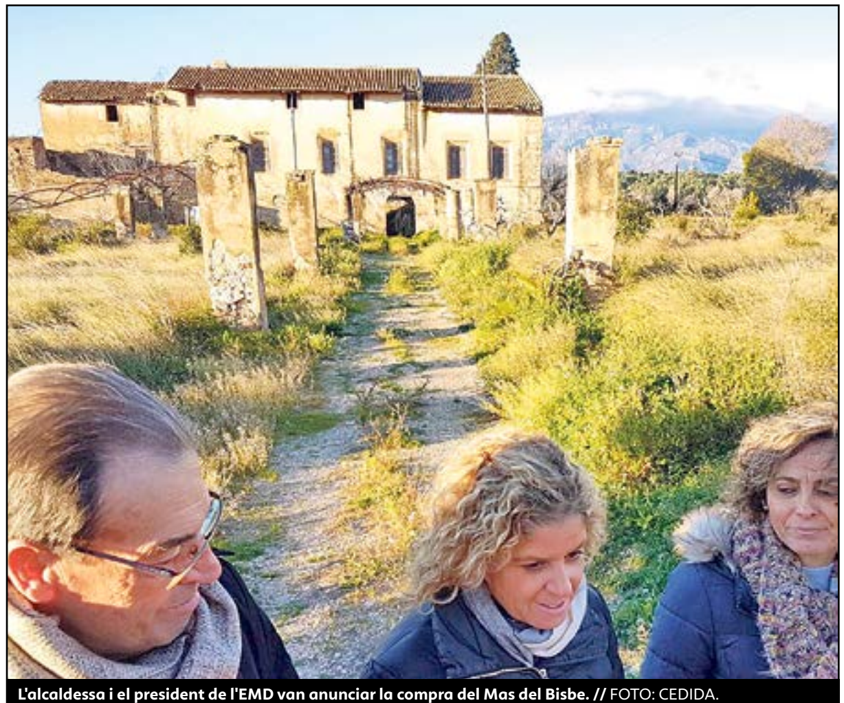
L'alcaldesa i el president de l'EMD van anunciar la compra del Mas del Bisbe.