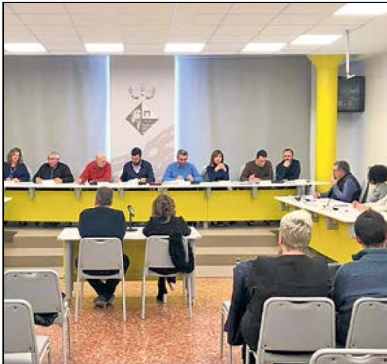
Una imatge de l'últim ple de Deltebre.

■ El canvi estava pendent fa dos anys per una moció de la CUP, que amenaçava de presentar un contenciós