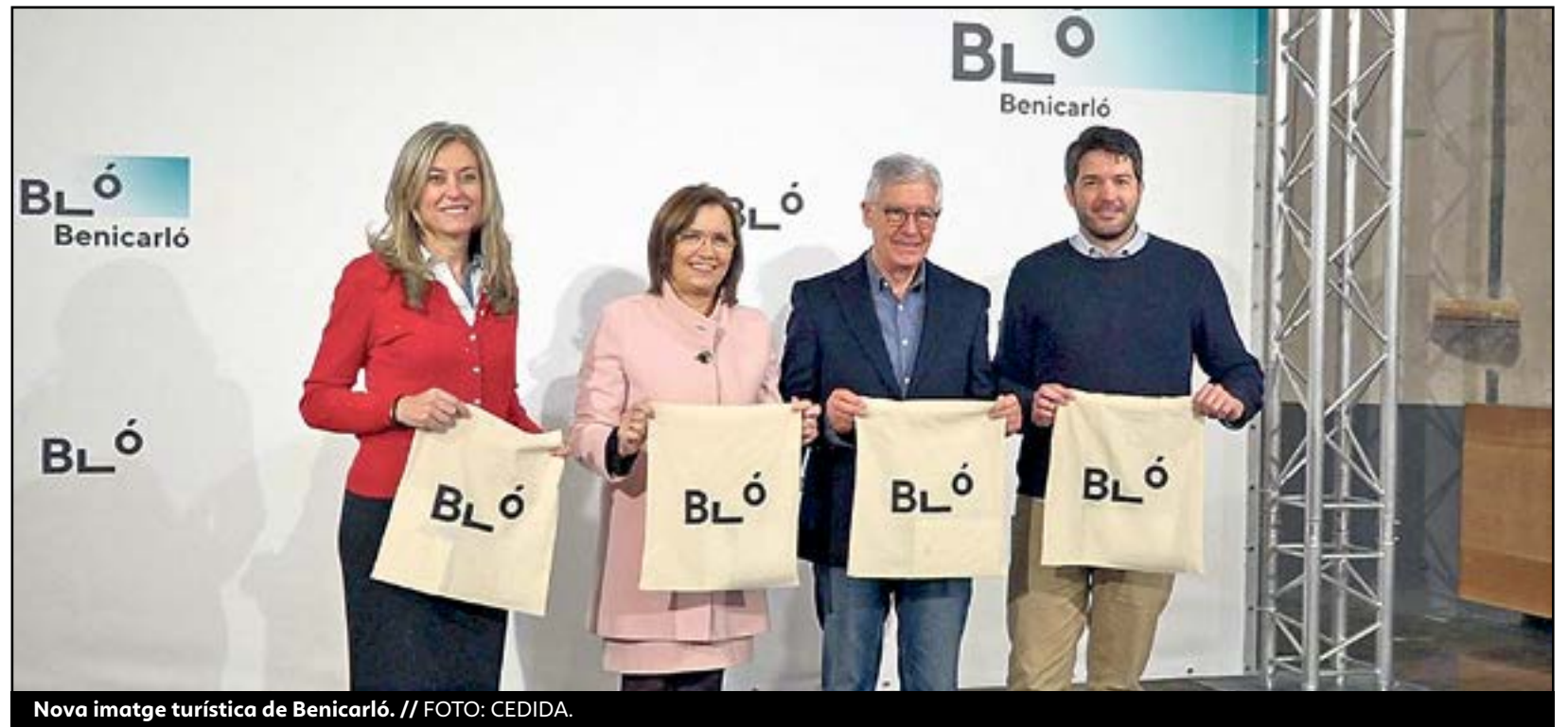
Nova imatge turística de Benicarló.

Per la seua banda, l'alcalde de Benicarló, Xaro Miralles, ha considerat que "amb esta marca es continua un camí ja iniciat