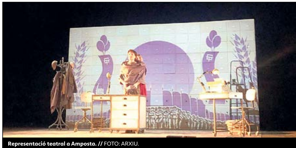
Representació teatral a Amposta.

L'obra protagonitzada per Oro, diumenge 17 de febrer a la tarda, serà la segona del calendari d'este primer trimestre. La gran majoria dels espectacles es representaran al teatre de la Lira Ampostina, amb un aforament màxim d'una mica més de 500 espectadors. L'obra de Víctor Català -pseu-