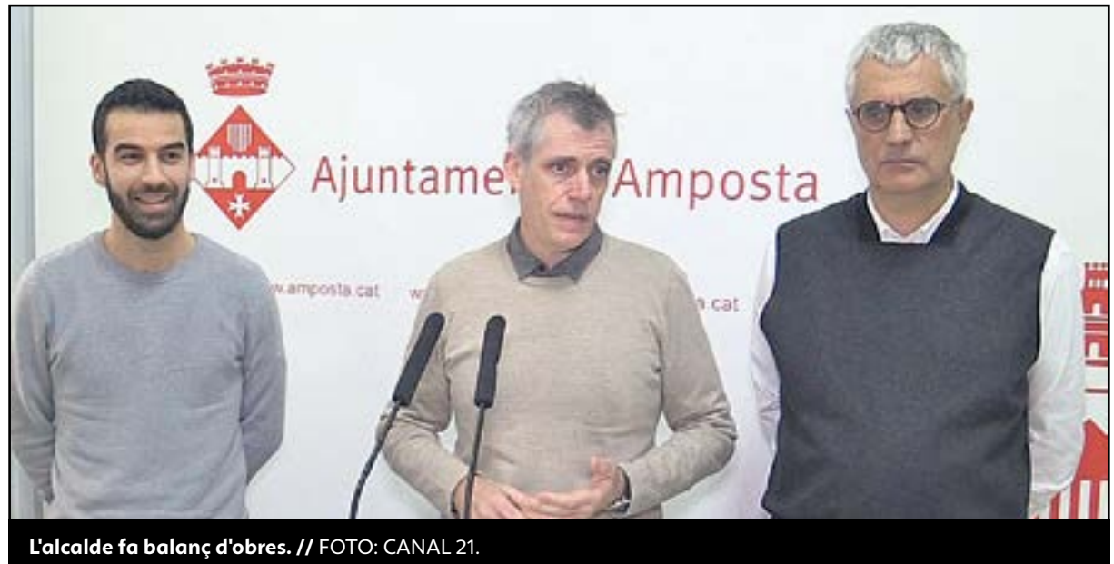
L'alcalde fa balanç d'obres.

Tomàs també va destacar que actualment hi ha en licitació, amb pressupost del 2018, dues obres vinculades al Pla de Foment Turístic que ascendeixen les dos fins a 193.000 euros i que el consistori té sobre la taula, pendent d'iniciar la licitació les pròximes setmanes, més d'un milió d'euros