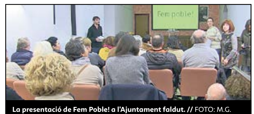
La presentació de Fem Poble! a l'Ajuntament faldut.

al projecte pot presentar la seua candidatura fins al 14 de febrer. Mentrestant, el programa electoral s'elaborarà entre tots. Paral·lelament, el PDeCAT i Esquerra han emès un comunicat conjunt per confirmar que a Ulldecona es presentaran a les eleccions del maig per separat, però que després de les municipals donaran suport a la llista republicana més votada. ■ M.G. / G.M.