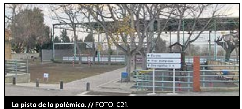
La pista de la polèmica.