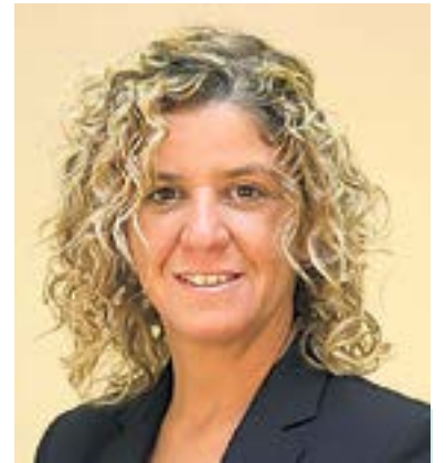
MERITXELL ROIGÉ ALCALDESSA DE TORTOSA

MENTRESTANT , també hem de continuar la tasca per recuperar altres elements singulars del nostre patrimoni: sense anar més lluny, també a Bitem, amb la colònia Gassol, que a dia d'avui encara no és de titularitat municipal, encara que no hi renunciem. Però també al nucli urbà, on durant aquest mandat hem adquirit un altre element singular que també era privat, el castell de Tenasses, o hem començat a recuperar l'antic balneari del Porcar, a Remolins. En són només alguns exemples d'una nodrida llista. Ens cal molt esforç per fer front a tot el llegat patrimonial del qual disposa Tortosa, i necessitarem dedicar-li molts recursos. Hi seguim treballant i no defallim. ■