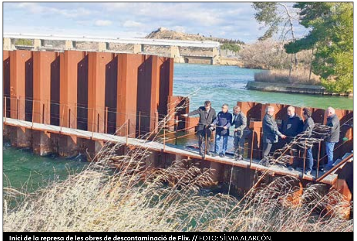
Inici de la represa de les obres de descontaminació de Flix.

En este aspecte, el laude arbitral, que s'ha dut a terme a la Cort d'Arbitratge de Madrid, ha resolt que FCC va complir "correctament amb les seues obligacions contractuals" en els treballs de descontaminació del pantà de Flix i que va seguir les instruccions de la direcció d'obra designada per Acuamed. La Cort con-