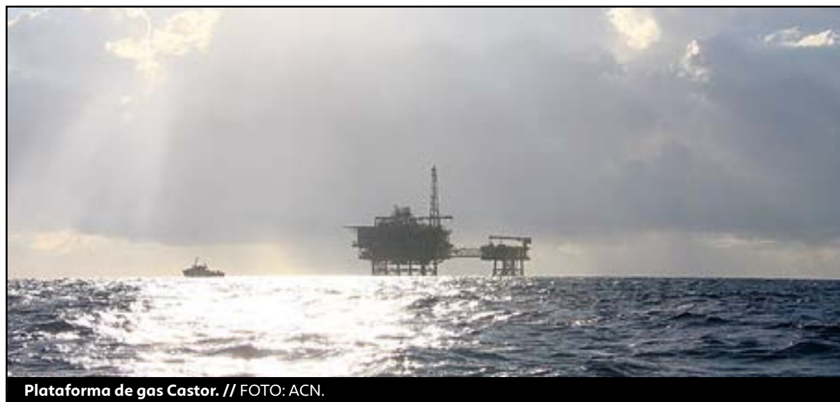
Plataforma de gas Castor.

Han estat necessaris cinc anys i quatre mesos de despeses milionàries i obscurantisme tècnic