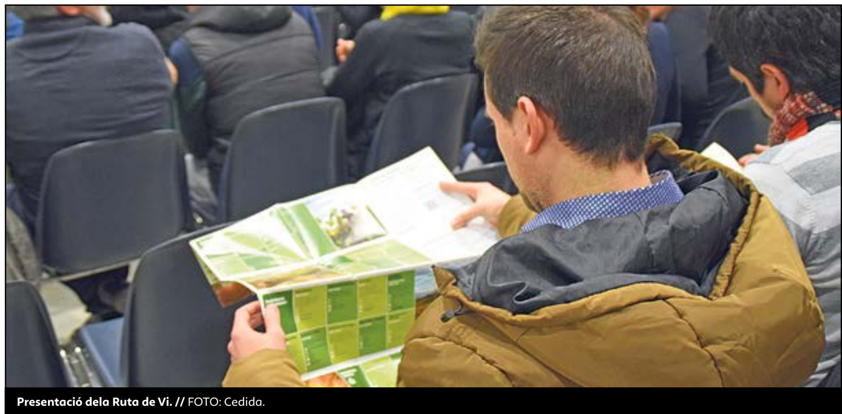
Presentació de la Ruta de Vi.

La Ruta del Vi és un projecte col·laboratiu entre el Consell Comarcal de la Terra Alta i la Denominació d'Origen Terra Alta, i que suposa un important pas endavant en la promoció de l'oferta enoturística de la zona des d'un punt de vista global i conjunt, involucrant a tots els actors que intervien, des dels cellers fins a restaurants,