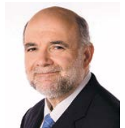
JOAN SABATÉ SUBDELEGAT DEL GOVERN DE L'ESTAT A TARRAGONA

TOT EL DEMÉS , és fer "volar coloms" i com diu l'Eclesiastès 1:9, "No hi ha res de nou sota el sol"... ■