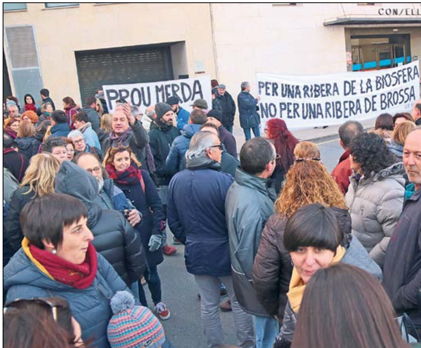
Una imatge de la concentració que va fer-se a Móra d'Ebre, amb motiu de la trobada del consell d'alcaldes de la Ribera d'Ebre.

Però el projecte ha generat una fota oposició a la Ribera d'Ebre i el sud del Segrià. Ja el diumenge 29 de desembre, alcaldes, regidors i altres càrrecs polítics de diferents partits van reunir-se a la Torre de l'Espanyol per mostrar el seu rebuig frontal al projecte. Consideren que l'abocador és "una nova agressió" al territori, i van deixar clar que aposten per un altre model de comarca, més sostenible. Tot seguit, el 4 de gener va fer-se el Consell d'Alcaldes en què es va consensuar la moció que ERC ha portat a les diverses institucions. ■