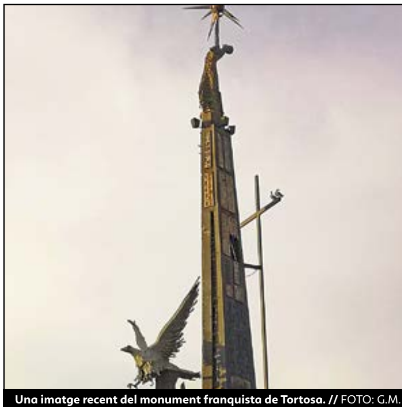
Una imatge recent del monument franquista de Tortosa.