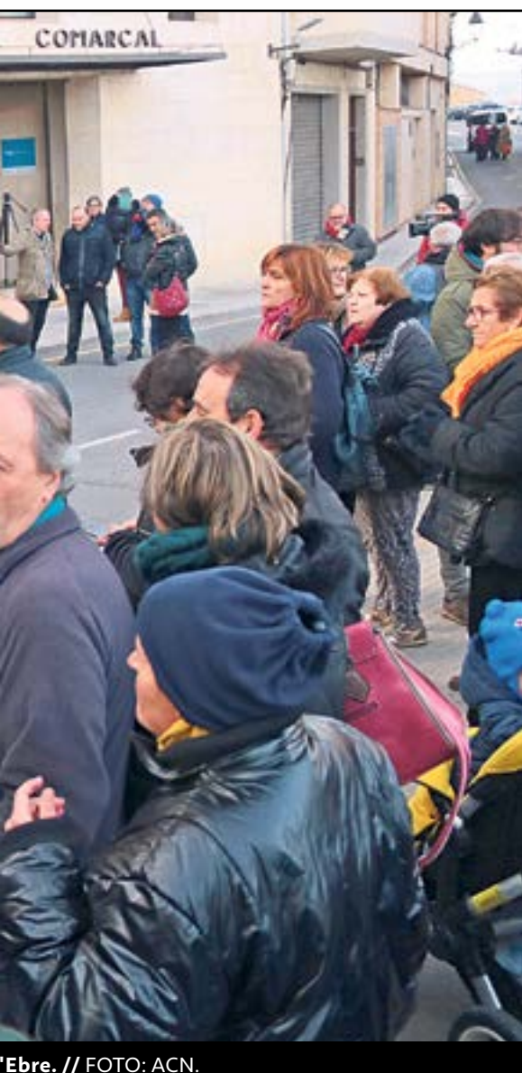
Ebre. // FOTO: ACN.