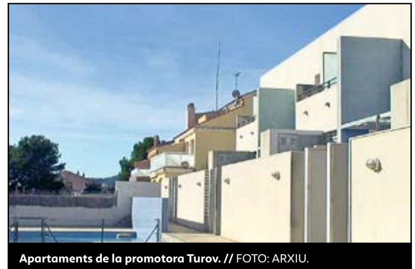
Apartaments de la promotora Turov.

Així les coses, des de la representació legal dels propietaris en la figura de l'advocat Llorenç Cortadella, s'ha situat el dany moral, seguint el criteri establert pel mateix Tribunal Suprem, entre el 30% del valor de la reclamació patrimonial establerta en la taxació de cadascun dels afectats, principalment en els casos que l'apartament era l'habitatge habitual, per exemple, i un 10%, per als de menor afectació, com el cas de segones residències. ■