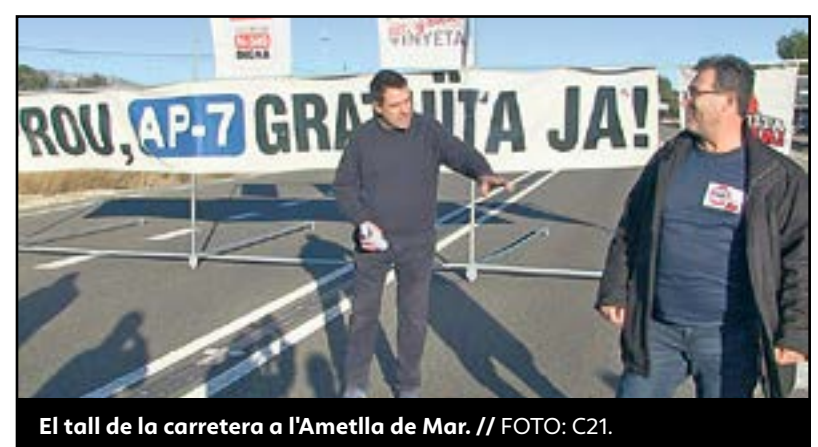
El tall de la carretera a l'Ametlla de Mar.